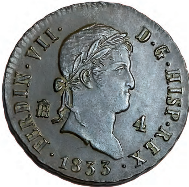
4. Moneda de Fernando VII de 4 maravedís.