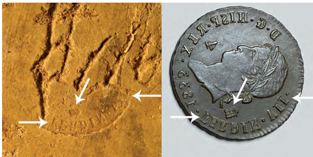
5. Fotomontaje de la impronta con la moneda de referencia que se ha invertido digitalmente para presentarla en negativo y se ha girado a la misma posición de la impronta.

Aunque es el único caso que ha conseguido la impresión de parte de la leyenda de la moneda, hemos detectado en su alrededor algunos círculos también impresos que deben de constituir otros tantos intentos fallidos y que no nos proporcionan mayor información [fig. 3].