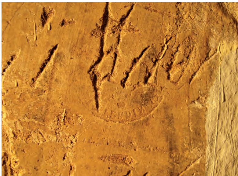
2. Detalle de la impronta.

e incluso fusilamientos. 7 Nuevamente, las armas representadas en las paredes de la cárcel nos apoyan en nuestro discurso, dado que dominan las armas de «piedra» (pedernal) frente a las de pistón, cuyo uso se popularizará a partir de 1840. 8 Todo ello nos proporciona una datación ante quem para la impronta metálica que nos atañe.