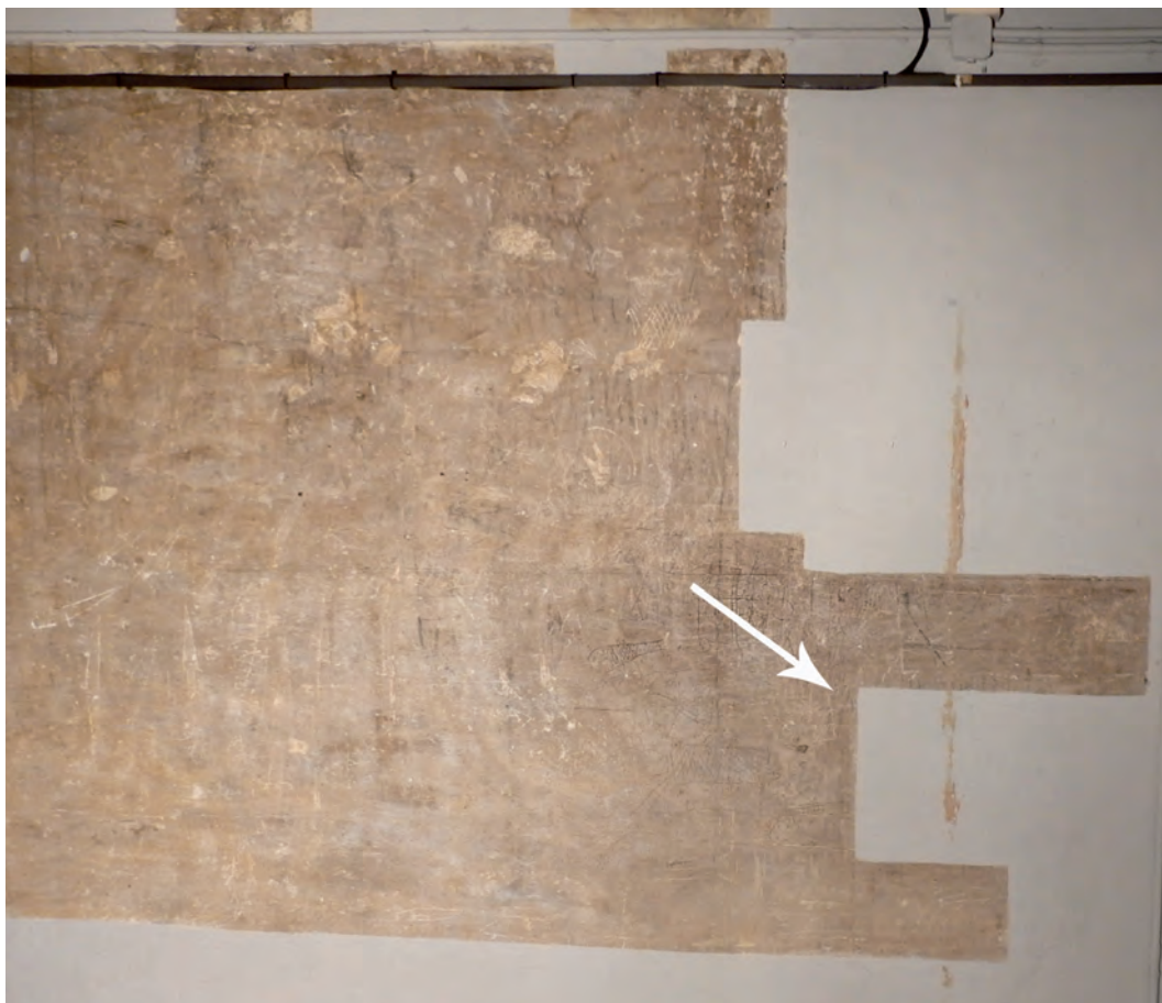
1. Fotografía de la pared B del espacio 3 con la ubicación de la impronta.

Esta estancia alberga el conjunto de graffiti más recientes, con una cronología que se sitúa en el siglo XIX. 5 Aunque las inscripciones son escasas, por el tipo de armas representadas, así como por la indumentaria de los personajes podemos establecer que se produce una primera ocupación en el contexto de la guerra de independencia (1808-1814), quizás a su finalización. Además, se han