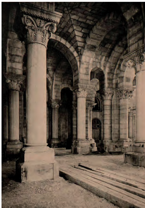
FIG. 6. Hauser & Menet, fototipia «Catedral de Madrid. Vista parcial de la cripta» en Resumen de Arquitectura , vol. 7 (01 de junio de 1897), Hemeroteca Digital de la Biblioteca Nacional de España.

Como se puede observar, España Ilustrada es un elemento importante en el conocimiento de la obra de Hauser & Menet. En primer lugar, permite un acercamiento al archivo de imágenes del que la empresa disponía en sus comienzos (entre 1890 y 1896), así como su visión fotográfica, ya que existe la posibilidad de que los originales fueran obtenidos por ellos, o por sus colaboradores más estrechos. Las fechas de publicación de algunas fototipias en las revistas estudiadas, revelan su disponibilidad en el mercado antes de la edición de los cuadernillos de España Ilustrada (1897-1899), lo que manifiesta una voluntad de los autores de diversificar sus productos, más allá de la postal, haciendo llegar la imagen arquitectónica y artística de España, tanto a las masas, como a una élite culta con la que se relacionaban. El éxi-