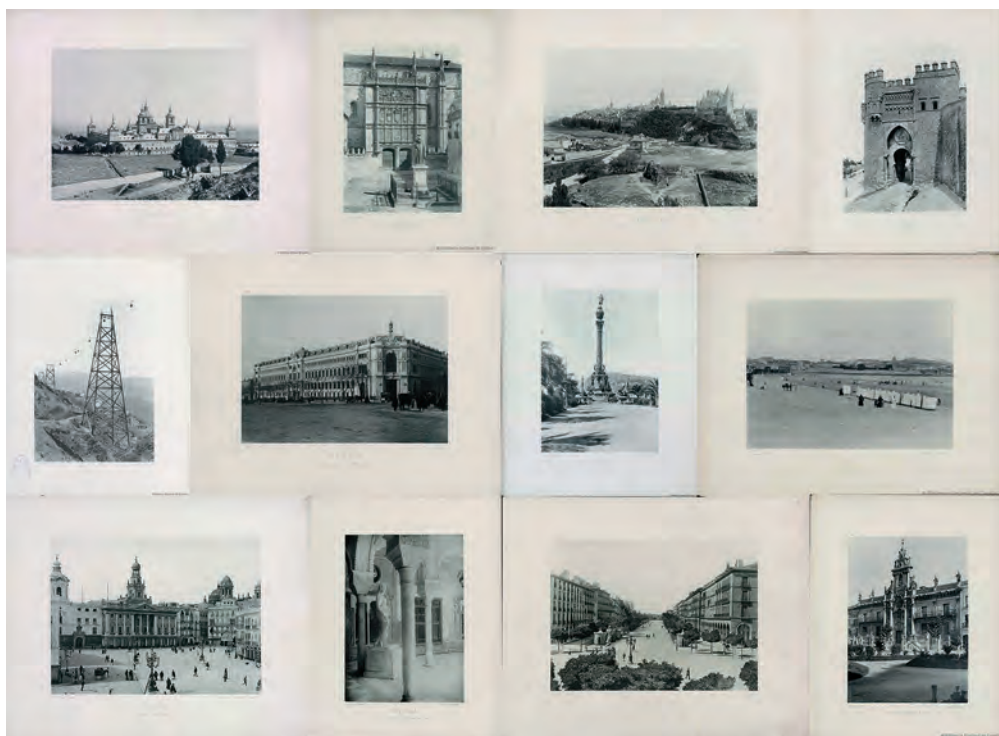
FIG. 2. Compilación de 12 láminas de España Ilustrada . De izquierda a derecha y de arriba a abajo: nº 400: «El Escorial: El Monasterio», nº 226: «Salamanca: fachada de la Universidad», nº 110: «Segovia: Vista general», nº 128: «Toledo: la Puerta del Sol», nº 199: «Bilbao: Orconera Iron Ore C o en Luchana», nº 104: «Madrid: El Banco de España», nº 270: «Barcelona: Monumento de Colón», nº 405: «Gijón: la playa de baños», nº 78: «Cádiz: Plaza de Isabel II», nº 91: «Sevilla: Casa de Pilatos: ángulo del Patio», nº 291: «Zaragoza: Paseo de la Independencia» y nº 219: «Valladolid: La Universidad». (Hauser y Menet, 1890-1896). Biblioteca Digital Hispánica.

Las imágenes de las 488 láminas numeradas que se han encontrado recogen vistas de 28 provincias del territorio español, aproximadamente la mitad de las que existían en el momento, manteniéndose esta representación en los cuadernillos. El repertorio combina vistas de los más notables monumentos españoles, como pueden ser la Alhambra, el Escorial, la Mezquita de Córdoba, la Catedral de Sevilla, la Universidad de Salamanca, etc., con vistas de edificios