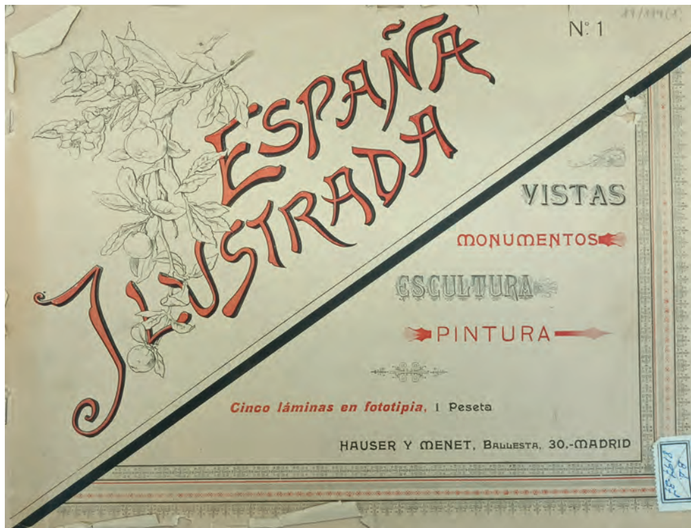
FIG. 1. Portada del primer cuadernillo de la serie España Ilustrada (Hauser y Menet, 1897). Ejemplar consultado en la Biblioteca Nacional de España.

Además, cabe enmarcar esta obra en el contexto decimonónico, en el que, desde comienzos de siglo, habían surgido publicaciones, españolas y extranjeras, que pretendían hacer un compendio visual de aquellos monumentos y obras artísticas que definían el país. Desde libros ilustrados mediante grabados e influidos por el romanticismo como Spanish Scenery (1838), de George Vivian o los tomos de Recuerdos y Bellezas de España (1839-1865), con litografías de F.J. Parcerisa; pasando por el intento más Académico y especializado de Monumentos Arquitectónicos de España (1852-1881), a los compendios fotográficos de Clifford y Laurent; por