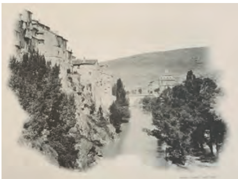
FIG. 5. Fototipia «Cuenca. Orillas del Júcar» en España Ilustrada, cuadernillo nº 33 (Hauser & Menet, 1897-1899, p. 162).

En cuanto a las diferencias formales entre las dos ediciones de España Ilustrada , son muy pocas, siendo las más significativas, quizás, el tipo de papel utilizado, de peor calidad en los cuadernillos, la utilización de clichés ligeramente diferentes para una misma vista, la introducción de pequeños retoques, como la eliminación del cielo en alguna imagen o el difuminado de los bordes. Esto último se aplicó a 46 fototipias, sin un criterio aparente, pero