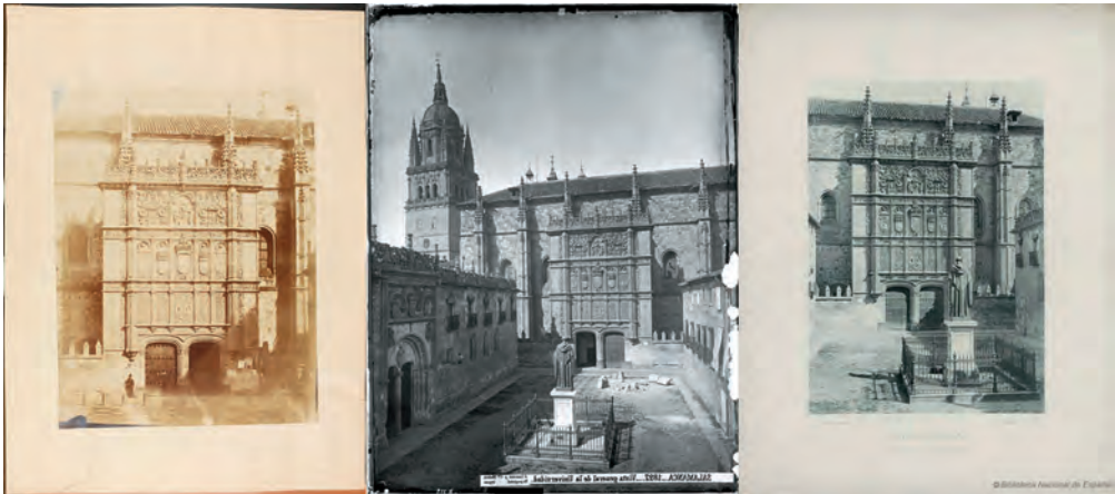
FIG. 4. Vistas de la puerta de la Biblioteca de la Universidad de Salamanca. De izquierda a derecha: «Puerta de la Biblioteca de la Universidad de Salamanca». Albúmina sobre papel fotográfico, 421 x 321 mm, (Charles Clifford, 1853), Museo Nacional del Prado; fotografía «Salamanca, Vista General de la Universidad» (Jean Laurent, 1860-1886), Archivo Ruiz Vernacci, Fototeca IPCE, Ministerio de Cultura y Deporte y fototipia «Salamanca: Fachada de la Universidad», nº 226 de la serie España Ilustrada , (Hauser y Menet, 1890). Biblioteca Digital Hispánica.