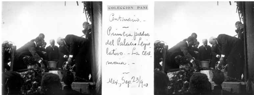
FIG. 3. El Presidente Porfirio Díaz colocando la primera piedra del Palacio Legislativo (hoy Monumento a la Revolución) durante las Fiestas del Centenario, 1910.

viajes y lujos innecesarios. Sin llegar a ser pobres, la familia Pani Arteaga comenzó a vivir una época de estrechez económica.