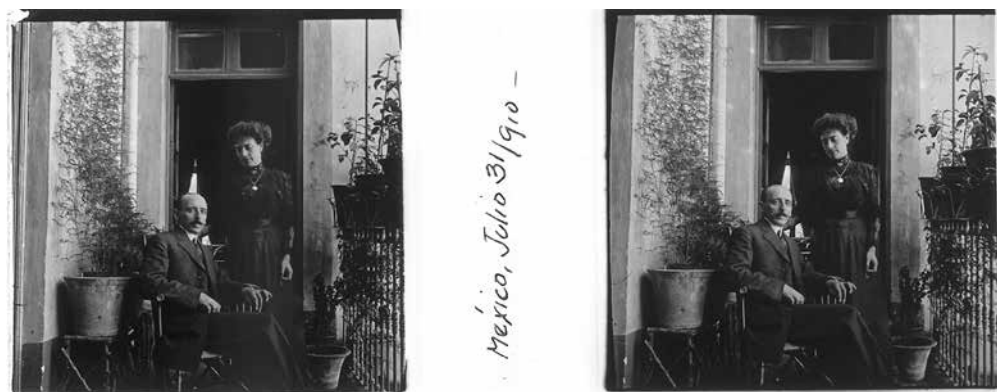
FIG. 2. Arturo Pani Arteaga y Dolores Darqui, 1910.

El inventario de la colección arrojó la existencia de 2320 positivos y 1140 negativos. La mayoría estas placas estereoscópicas cuentan con un número rotulado que no es continuo y a veces se repite. Los 2320 positivos están rotulados con un título que hace referencia a la imagen contenida en la placa, título que corresponden al listado de Arturo Pani; el resto de las placas no posee información.