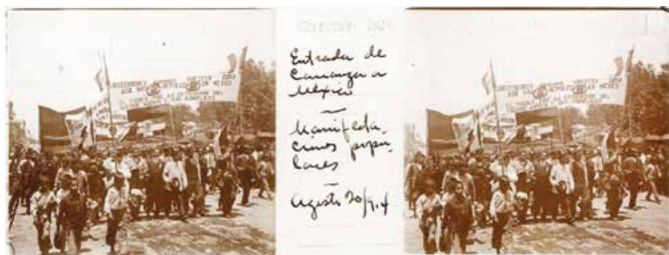
FIG. 4. Entrada de Carranza a México, Manifestaciones populares, 1914.

Al leer los textos de Arturo Pani uno puede percatarse de que hay información repetida, lo que no es de extrañar pues se trata de cuatro miembros de la misma familia. La lectura de la autobiografía, titulada Ayer , deja la sensación de que la colección pudo ser la base de dicho texto. Muchos lugares captados con la cámara son descritos ampliamente en el libro, otros cuentan con la anécdota de aquellos viajes, es decir, las vistas se corresponden con el libro.