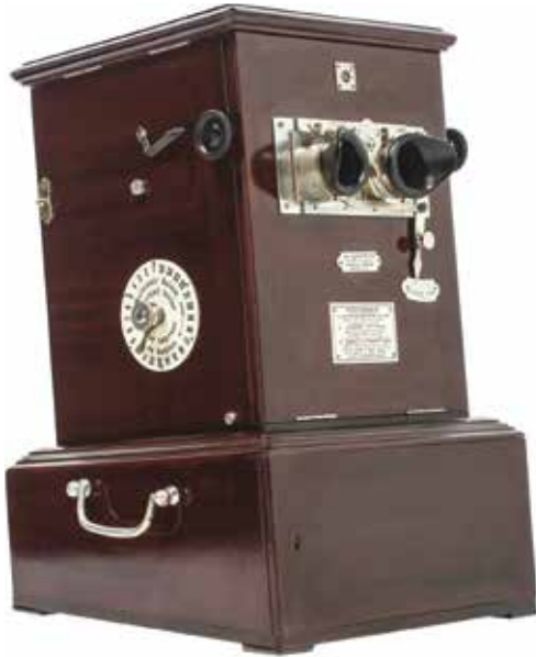
FIG. 1. Taxiphote después de la restauración.

la solución al problema de almacenaje de placas de vidrio de los consumidores de productos Richard.