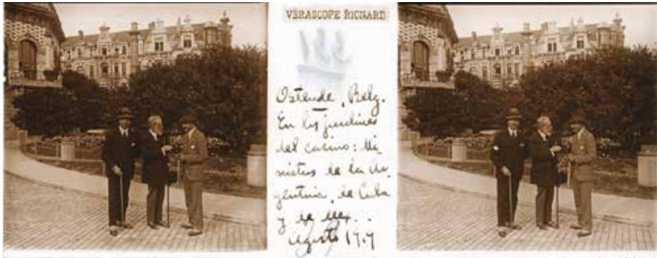
FIG. 5. Ministros de Argentina, Cuba y México en los jardines del Casino Kursaal en Ostende, Bélgica, 1919.

los nombres de otros delegados se los reserva, no quiere problemas, sus hijos lo acompañan a todas partes y les toma fotos (FIG. 5).