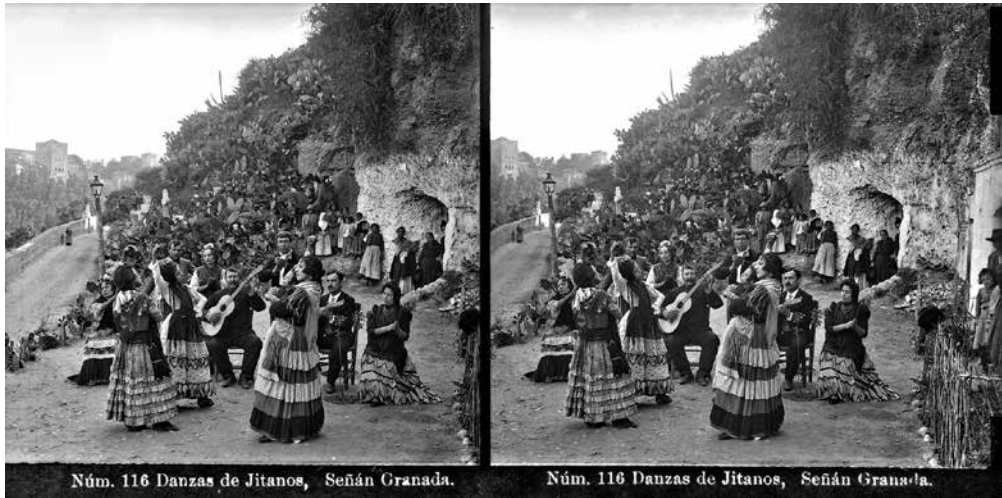
FIG. 2. Rafael Señán González. N.º 116: Danzas de Jitanos . Granada. Circa 1905. Negativo de cristal al gelatinobromuro. Archivo Histórico del Palacio de Viana, Córdoba.