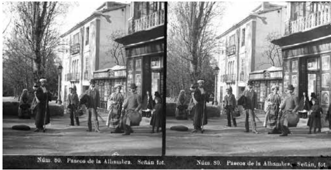
FIG. 1. Rafael Señán González. N.º 50: Paseos de la Alhambra . Granada. Fachada de la galería Señán. Circa 1905. Negativo de cristal al gelatinobromuro.

desde 1910 y con cerca del millar de vistas 3D (Rivero, 2019) y, la aún más tardía, colección Rellev del editor José Codina, distribuida desde 1929 y con más de 2.500 fotografías (Rivero, 2019).