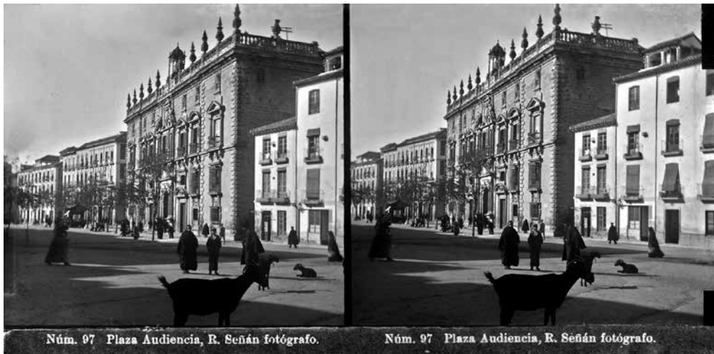
FIG. 6. Rafael Señán González. N.º 97: Plaza de la Audiencia, Granada. Circa 1905. Negativo de cristal al gelatinobromuro. Archivo Histórico del Palacio de Viano, Córdoba.

estereoscópica más como un antropólogo que como un retratista profesional. Se diría que es un viajero al que le sorprende todo, y utiliza su cámara para fotografiar desde una cabra en mitad de una avenida, a la algarabía callejera de una festiva calle de pueblo.