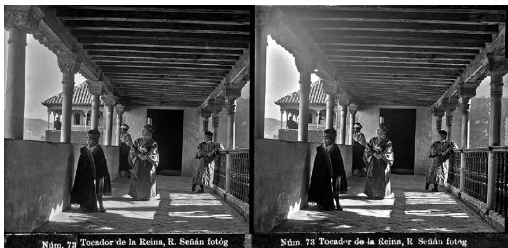
FIG. 4. Rafael Señán González. N.º 73: Tocador de la Reina, Alhambra, Granada . Circa 1905. Negativo de cristal al gelatinobromuro. Archivo Histórico del Palacio de Viana, Córdoba.

Alejándonos de la Alhambra, su estilo estereoscópico callejero se acentúa aún más. De hecho, en las tomas de otras localidades, da la sensación de que Señán utiliza la cámara