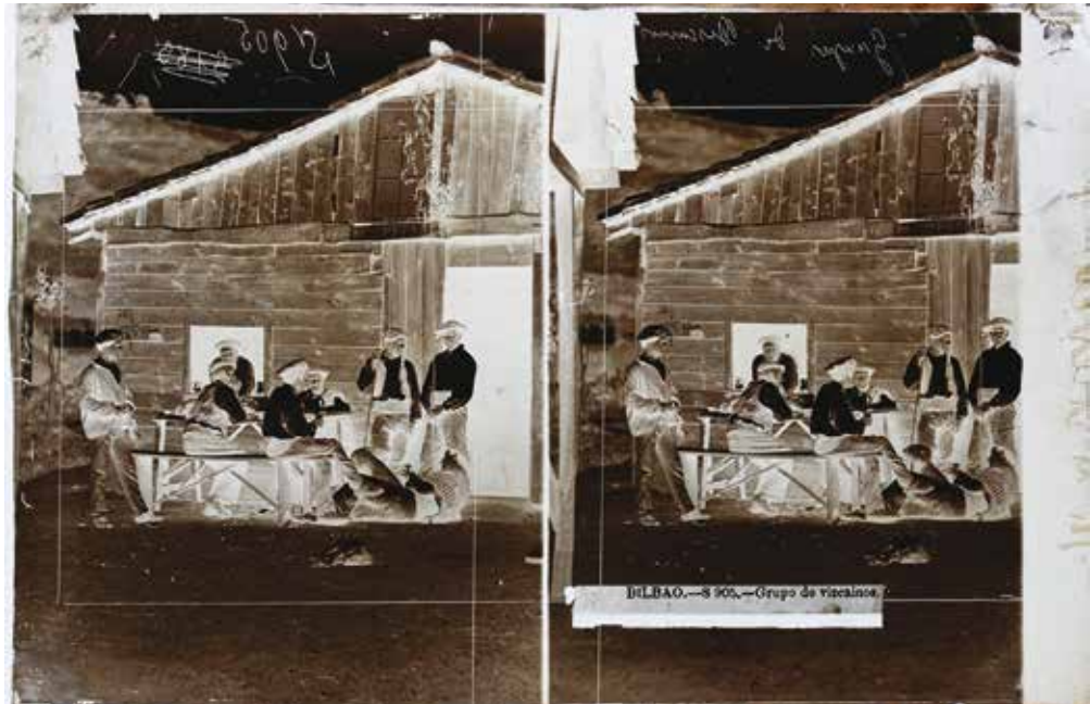
FIG. 1. Negativo de Laurent «BILBAO.-S 905.-Grupo de vizcaínos», año 1865 (IPCE: Fototeca, VN-17379).

Otra característica de la fotografía estereoscópica «S 905» es que sus dos imágenes no fueron tomadas al mismo tiempo, sino sucesivamente, pues algunos personajes se movieron ligeramente entre una y otra toma. Pero el resultado final es muy bueno, aparentando una escena espontánea, cuando en realidad estuvieron posando inmóviles.