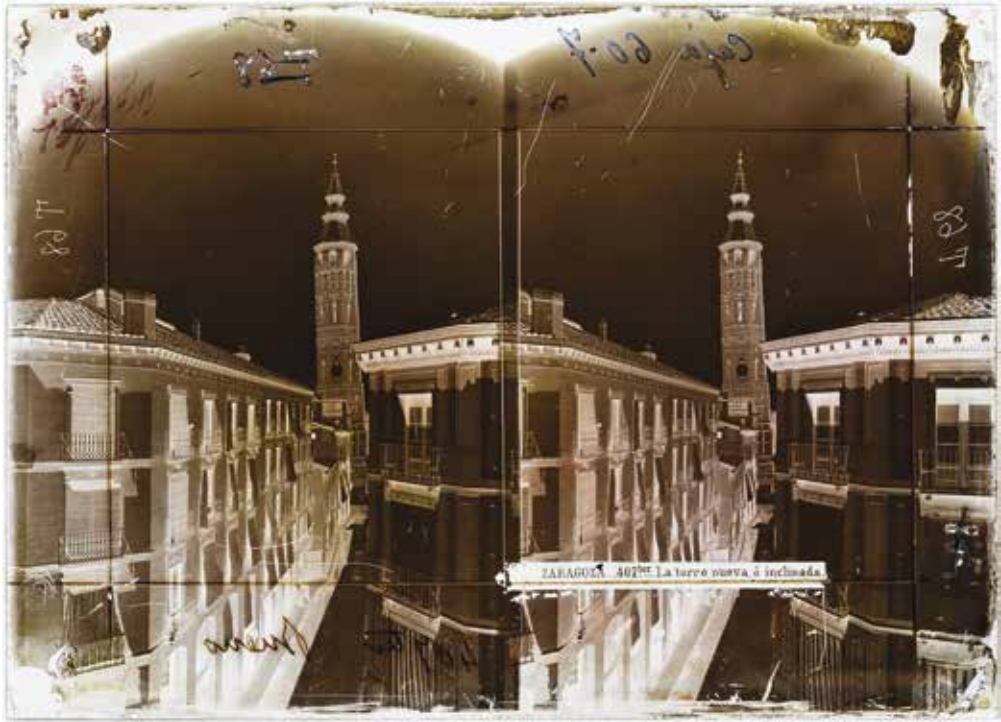
FIG. 5. Negativo de Laurent / Roswag «ZARAGOZA.-407ter.-La torre nueva, ó inclinada», hacia 1876 (IPCE: Fototeca, VN-17342).