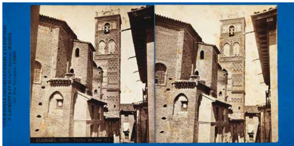
FIG. 6. Negativo y positivo de Laurent / Roswag «ZARAGOZA.-1699.-Torre de San Gil», hacia 1876 (IPCE: Fototeca, VN-17067 + JC-1996-L).