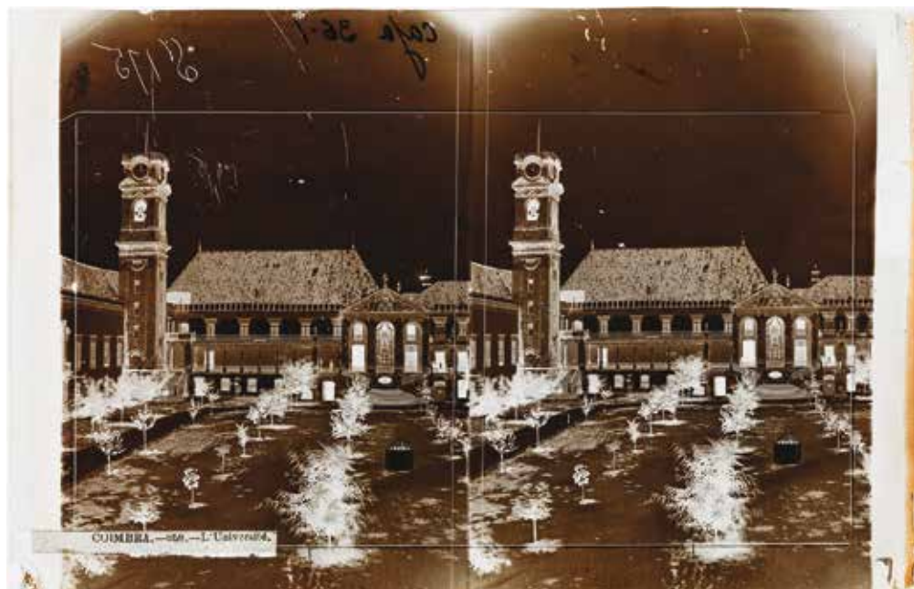
FIG. 2. Negativo de Laurent «COIMBRA.-858.-L'Université», año 1869.

Laurent viajó a Portugal a comienzos de marzo de 1869 (Araújo, 2019: 91). Llegó a Lisboa, procedente de Madrid, en tren. Durante unos tres meses estuvo obteniendo vistas en Lisboa y otras ciudades, como Coímbra y Oporto. También retrató a diferentes miembros de la familia real portuguesa, como el rey Luis I, y el antiguo rey consorte Fernando II.