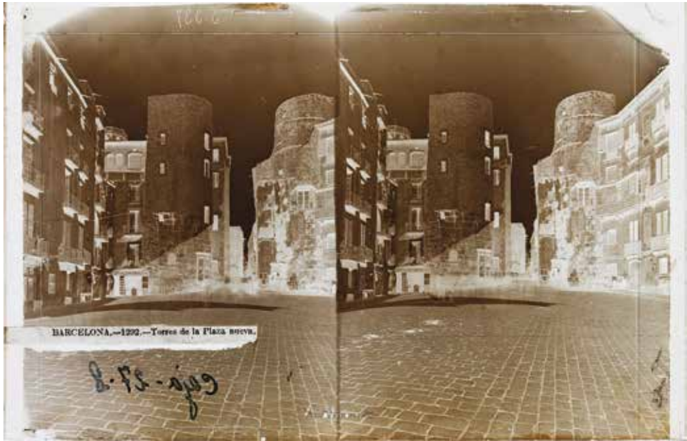
FIG. 3. Negativo de Ainaud «BARCELONA.-1292.-Torres de la Plaza nueva», año 1872 (IPCE: Fototeca, VN-17035).