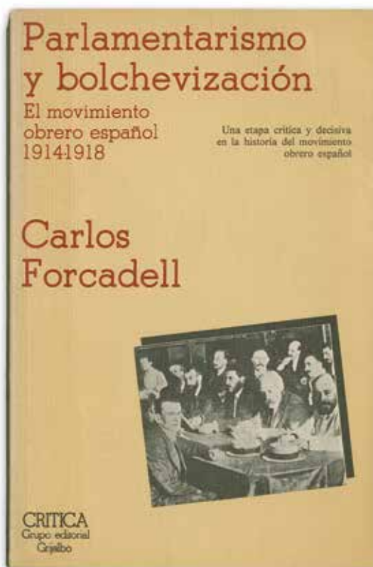
Publicación de la tesis doctoral en la editorial Crítica, 1978.

También coincidimos en varios encargos pedagógicos: un curso sobre Historia de Aragón en la Escuela de Verano de Aragón en 1980; y varias publicaciones de aquel ICE que dirigió Agustín Ubieto: Aragón en España. Programación para un estudio de la región en relación con España ; La ense-