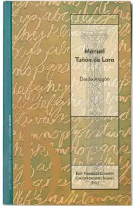
Monográfico sobre Manuel Tuñón. IFC, Zaragoza, 2002.