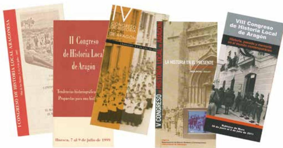
Programas de los Congresos de Historia Local de Aragón.

Hoy ya no es necesario justificar la orientación regional o local de la investigación histórica. Hace seis años sí. No ha sido este pequeño cambio. Pero sí que es conveniente hacer algunas reflexiones: no hay por qué ocultar que la historiografía regional es un elemento legitimador de la propia regionalización del Estado y de la voluntad política que la ha auspiciado y la defiende; pero hay también una razón previa y de carácter estrictamente científico e historiográfico, ya que han sido las grandes monografías regionales las que más han renovado y potenciado un conocimiento como el histórico, que para ser global y total necesita restringir y delimitar su objeto de análisis... Hoy es creciente el consumo de la historia de cada comunidad y su utilización docente en los diversos niveles. Pero hay que advertir que el conocimiento no se improvisa, y que difícilmente se puede divulgar algo que no se conoce.