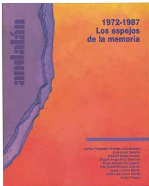
Libro conmemorativo en los 25 años de la fundación de Andalán.

ción china y la evolución del marxismo) en el ICE de Zaragoza, organizada por el Departamento de Francés de la Universidad. Fue una velada tan larga como apasionante. Nos confesó que le animaron a escribir un libro sobre la Gran Guerra sus profesores Pierre Renouvin y Fernand Braudel, a quien confesó quería como a un padre, y de su utilización del cine, todo tipo de documentales de la época: «es un rico material, está ahí, aún no sé por qué se ignora con tanta frecuencia por los historiadores e intelectuales en general». Y hablamos de La Revolución de 1917 , su tesis. (Años después del cierre de Triunfo , cuando Eduardo Haro Tecglen y José Ángel Ezcurra vinieron a Zaragoza a hacer entrega a la Universidad de las colecciones de Triunfo y Tiempo de Historia , se nos invitó a cenar con ellos, lo que hicimos encantados. Éramos, académicamente hablando, una irrefutable «pareja de hecho»).