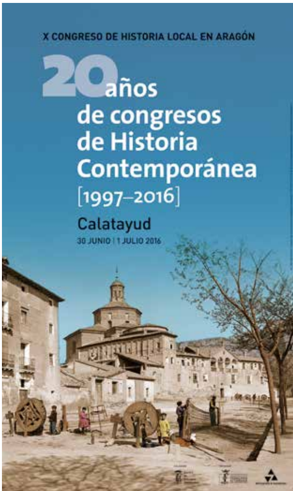
Los veinte años de congresos de Historia Local. Calatayud, 2016.

Y ya analizando la situación aragonesa, le asalta casi una década después, a fines del siglo XX, «la sospecha de si no oscurecimos, más consciente o inconscientemente, un cuadro que, interesados en protagonizarlo nosotros mismos, imaginábamos blanco, virgen y sin comenzar».