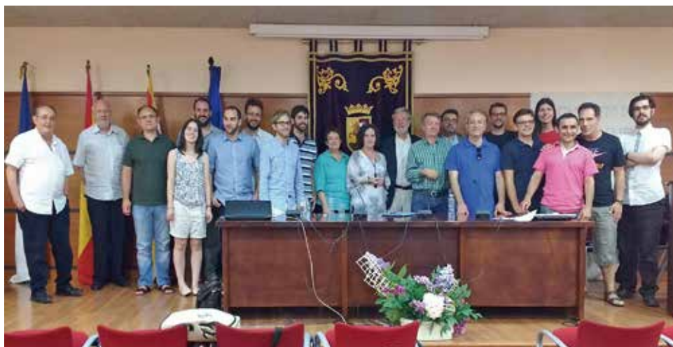
En la clausura del X Congreso de Historia Local de Aragón. Calatayud, 2016.