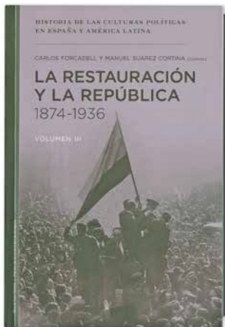
Volumen III de la Historia de las culturas políticas en España y América Latina , 2015.