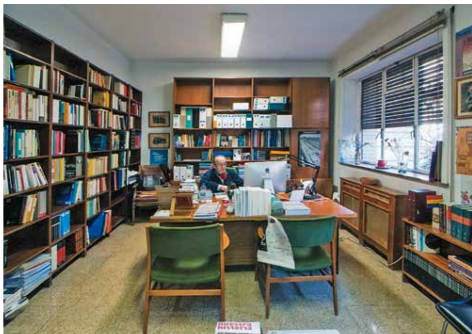
Despidiendo el despacho de la vieja Facultad de Filosofía y Letras, 2018.

ñol en Inglaterra durante la primera mitad del siglo XX (2014), o Gustavo Alares López, Las políticas del pasado en la España franquista (1939-1964). Historia, nacionalismo y dictadura (2014) 19 .