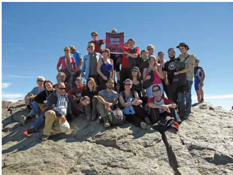
Ascensión al Veleta tras el XI Congreso de la Asociación de Historia Contemporánea. Granada, 2012.

impulsado la historiografía española desde los años 70. Bien como participante, bien como impulsor de iniciativas, su presencia y activismo han sido relevantes para comprender la evolución de la disciplina a lo largo de medio siglo. Valga esta oportunidad, tal vez algo forzada por una circunstancia administrativa que, seguramente, poco afecta al historiador, para recapitular sobre toda esta contribución.