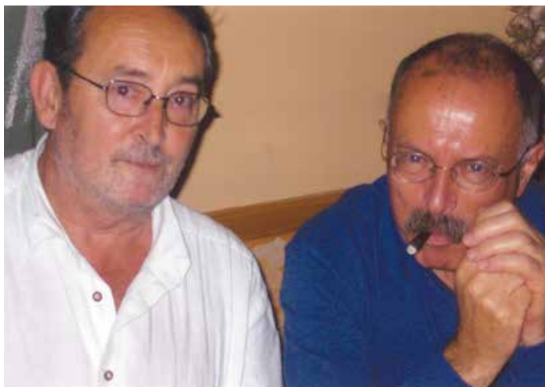
Con el historiador italiano Giovanni Levi en el V Congreso de Historia Local de Aragón. Molinos (Teruel), 2005.

Forcadell logró contagiarnos a muchos su interés por la historiografía agraria, en buena medida porque esa inquietud conllevaba plantear una actitud problemática y reflexiva ante el conocimiento y un espíritu crítico ante las fuentes (y ante la realidad del momento). Era necesario redefinir con más precisión conceptos como «mercado» o «capitalismo», por lo menos en el contexto de la historia agraria; interesaba destacar que estábamos ante formas de producción no puramente capitalistas pero conservadas como tales en tanto que servían y ayudaban al desarrollo del capitalismo por medio de mecanismos básicos de extracción del trabajo campesino, que podrían sintetizarse en apropiación por renta, a través del mercado y vía impuestos.