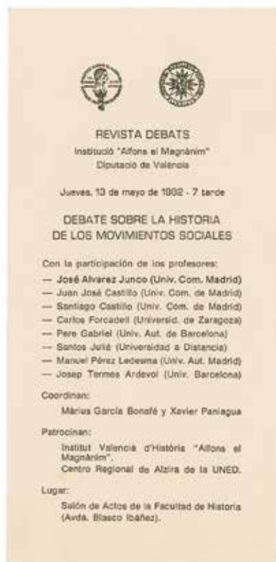
Coloquio organizado por la revista valenciana Debats sobre historia de los movimientos sociales, 1982.