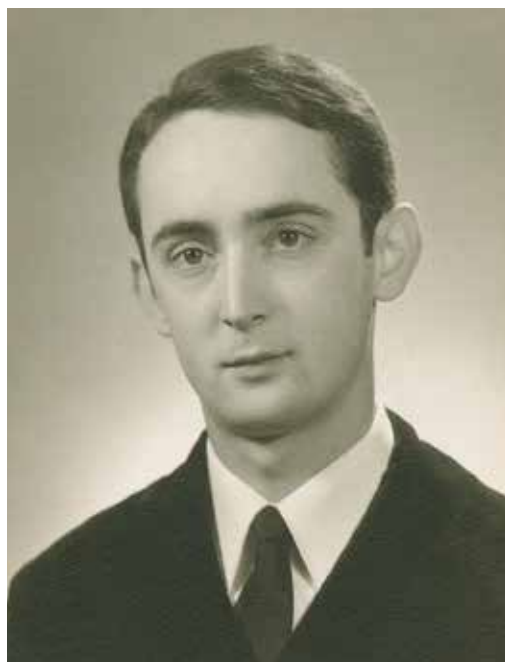
En la orla académica, 1968.