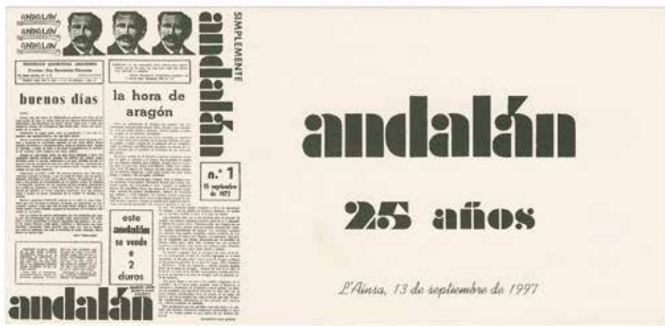
Tarjetón conmemorativo del 25 aniversario del nacimiento de Andalán , 1997.