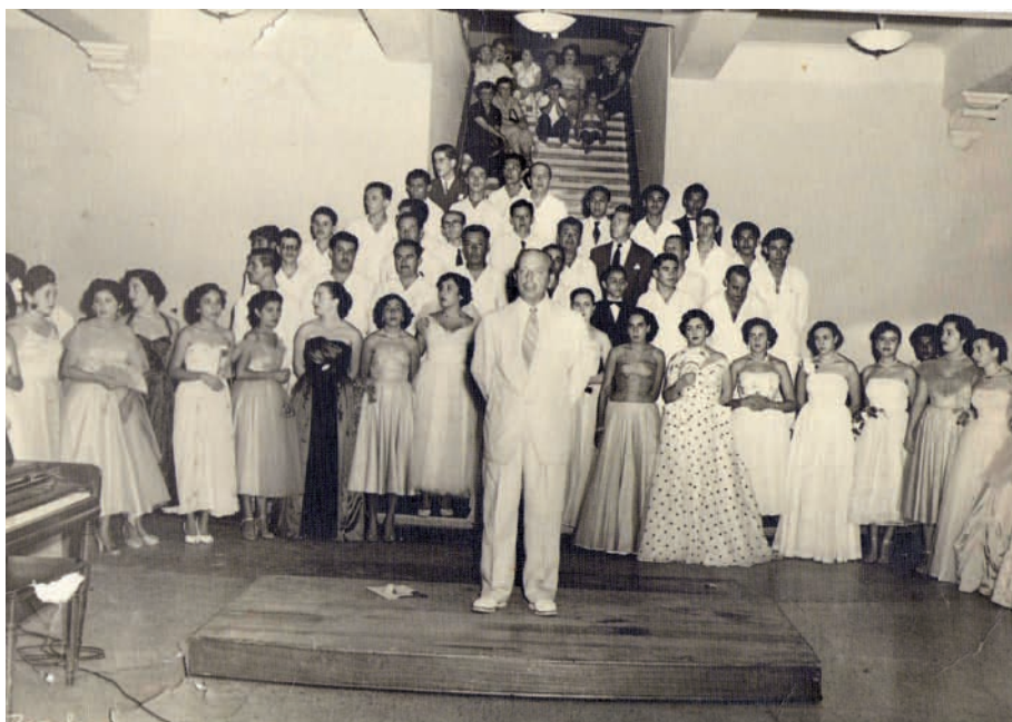
Fig. 2. Coro de Acapulco Guerrero dirigido por Simón Tapia Colman.

renombre 45 ; en el plano pedagógico, organizó cursos intensivos de capacitación musical para maestros y puso en marcha la creación de las Escuelas Pre-Conservatorianas. Profundo conocedor de la idiosincrasia del país y de los sistemas musicales europeo y americano –en 1955 fue enviado por la Secretaría de Educación Pública por las principales ciudades de Europa y Estados Unidos con el fin de analizar su funcionamiento–, y desde el desempeño de sus cargos públicos, diseñó una propuesta de reforma integral para la educación musical mexicana, si bien el contexto social circundante impidió que esta pudiera implantarse en su totalidad 46 .