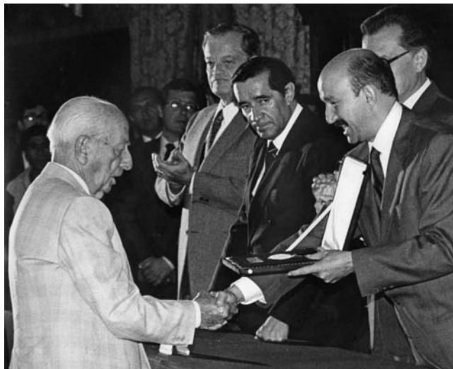
Fig. 3. Entrega de la Medalla Mozart.

1973 y dirigió hasta el 14 de noviembre de 1988 [...]» 54 ; académico de la Academia Nacional de Historia y Geografía en 1988 55 ; y Medalla Mozart en 1991 (Fig. 3), entregada por el presidente de México Carlos Salinas de Gortari, en reconocimiento a «su destacada contribución a la cultura musical dentro y fuera del país» 56 .