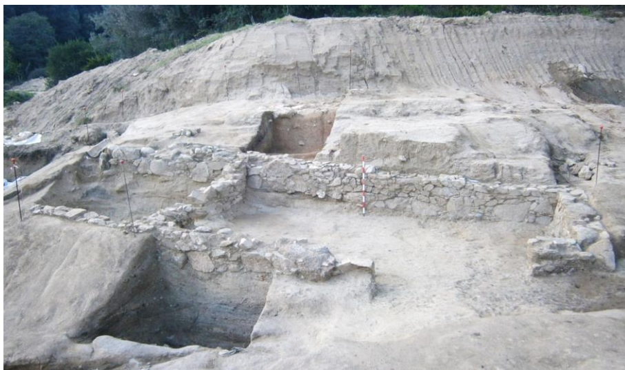
Fig. 2. Restos arqueológicos excavados en la parcela conocida como Can Canal.