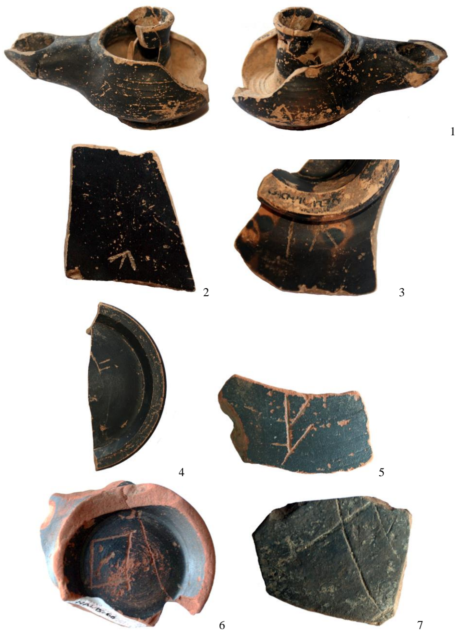
Fig. 2. Piezas 1-3 (Ca l'Arnau-Can Mateu); 4 (Can Rodon de l'Hort); 5-7 (Can Canal).