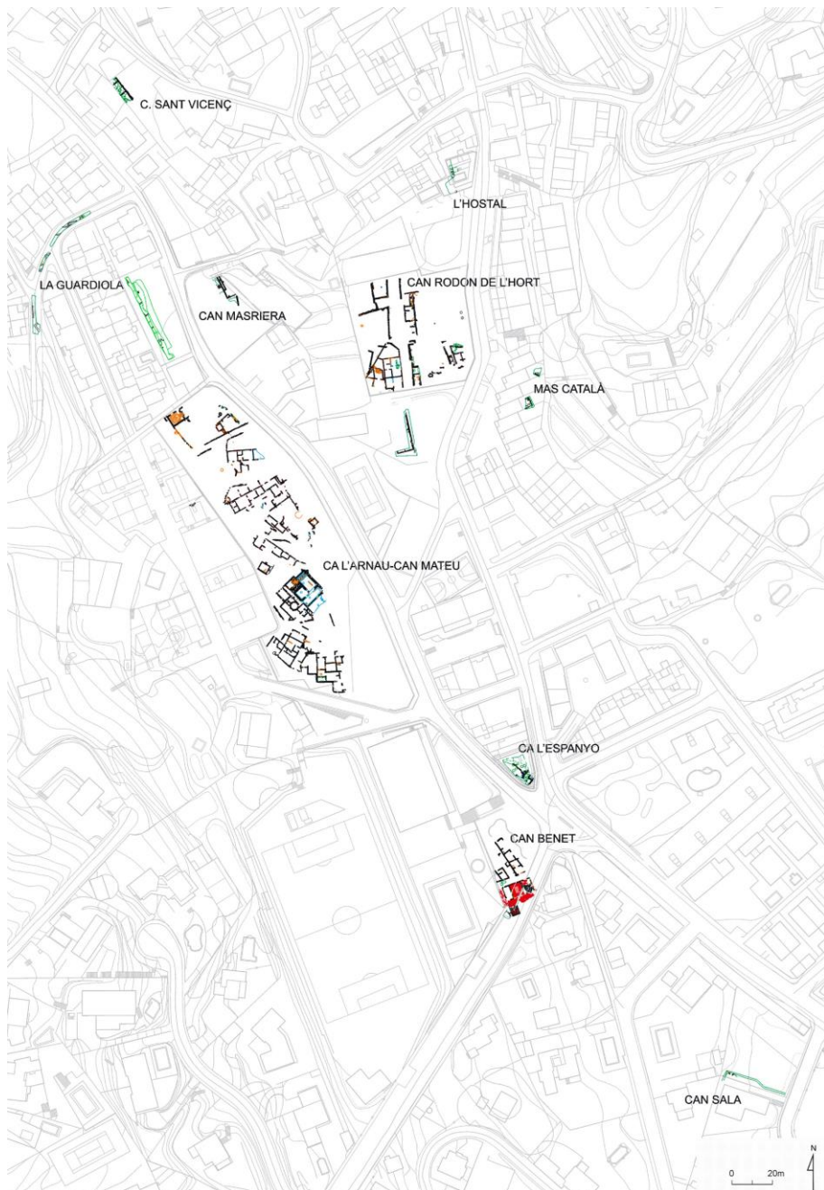
Fig. 1. Planta general del asentamiento tardo-republicano de Cabrera de Mar (Martín 2017, 324, fig. 8).