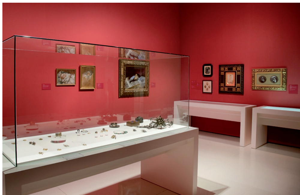
FIG. 4. Vista de una de las salas de la colección permanente de arte moderno del Museu Nacional d'Art de Catalunya.

de visita ejecutadas alrededor de 1860 por Napoleón, Josep Martí, Moliné y Albareda, Cantó y Cía. o Fotografía Franco Hispano Americana, entre otras empresas fotográficas o autores activos en Barcelona.