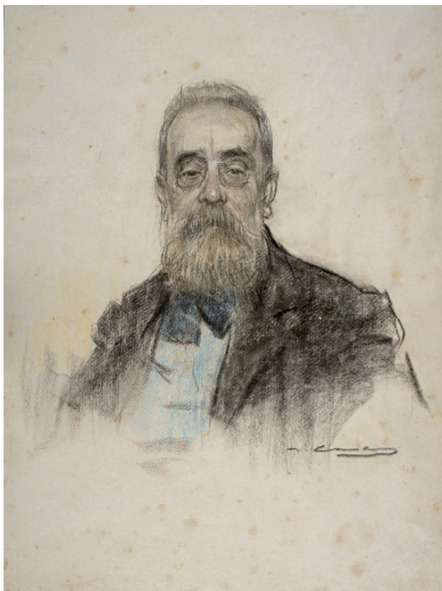
FIG. 2. Ramon Casas, Retrato de Salvador Sanpere i Miquel , c. 1905-1908, carbón y pastel (MNAC: 27299-D).