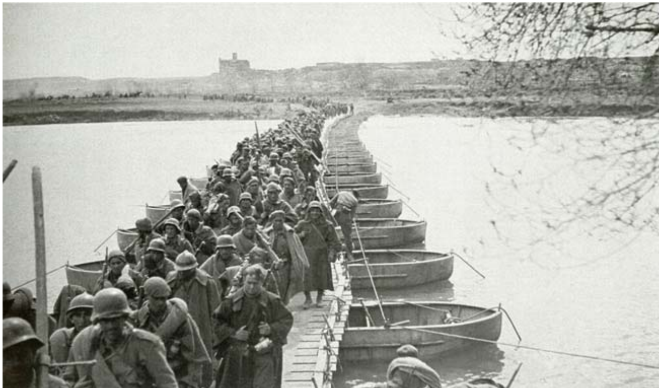
Paso del río Ebro por un puente de barcazas tendido en Quinto por los pontoneros de Zaragoza. Era la ofensiva final contra el Aragón republicano. 23 de marzo de 1938.