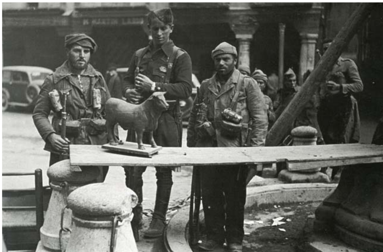
Soldados con el “torico” de Teruel, tras la recuperación de la ciudad por las tropas de Franco. Febrero de 1938.