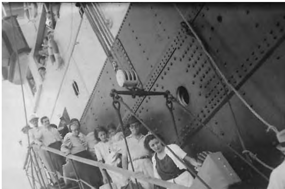
Desembarco de pasajeros.

olvidan de la cámara y la presencia de los Souza-Castillo pasa desapercibida, lo que permite captar escenas con gran naturalidad como aquellas donde los jóvenes toman el sol en bañador, matan el tiempo jugando ajedrez, son revisados por el médico de a bordo o donde las jóvenes son sorprendidas en amena charla con otros pasajeros.