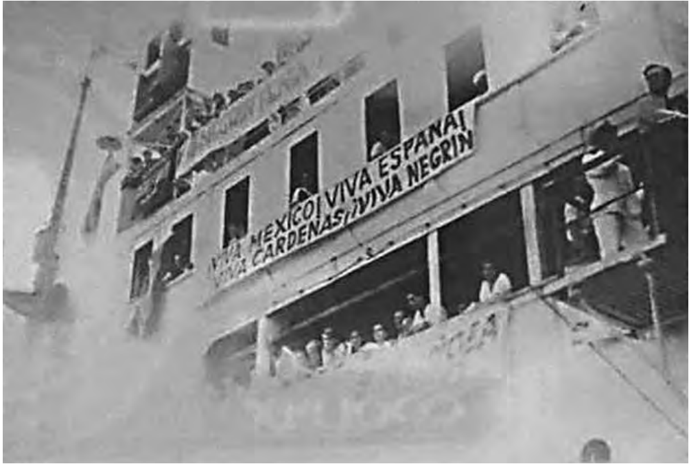
Cartel de bienvenida.

Los negativos nos permiten seguir el recorrido de los fotógrafos, las dobles tomas nos hablan de un cuidado por capturar el mejor ángulo o proponer poses. En términos generales vemos imágenes fraternas, compenetradas y naturales. Los fotógrafos son parte del grupo y los retratados no se percatan de su presencia más que en contadas ocasiones.