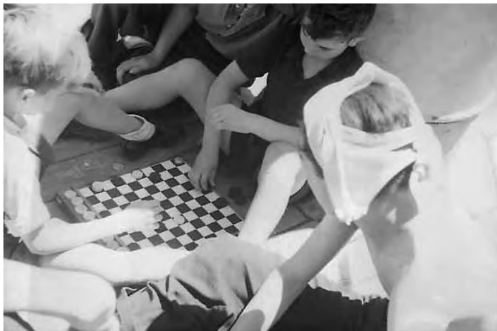
Niños jugando ajedrez.