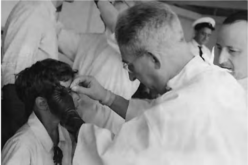
Revisión médica a bordo.

de la imagen viva, que siempre se muestra durante la flexión instantánea del acontecer histórico» (Gallardo, Testimonios: 48). Como la reunión de expresidentes en torno a Manuel Ávila Camacho en 1942, la Campaña de alfabetización en la década de los treinta, la desolada plaza de las Tres Culturas tras la matanza del 2 de octubre de 1968 o el obrero caminando en las alturas sobre vigas grises que después serían el rascacielos más grande de México en la segunda mitad del siglo XX, la torre Latinoamericana.