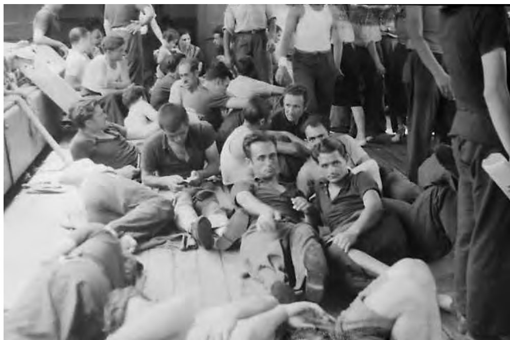
Descanso en la cubierta del barco.

Esta pequeña cantidad resguardada en México nos muestra que es prácticamente nulo el material referente a la guerra y su llegada al país y por tanto nos explica lo poco que ha sido