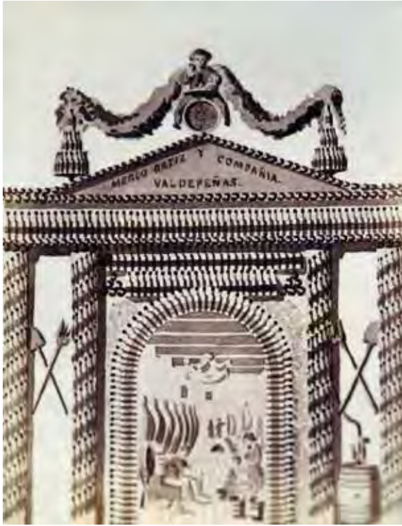
Muestra de una de las reproducciones de los bocetos que ilustran el álbum. En este caso de la instalación de la bodega Merlo Ortiz y Compañía, de Valdepeñas. (Bodegas Toro Albalá, Aguilar de la Frontera, Córdoba).

de las diferentes «instalaciones», perdiéndose así la gran oportunidad de haber realizado un auténtico reportaje fotográfico de la importante exposición vinícola de 1877. Como consecuencia de ello las imágenes más difundidas de la exposición fueron las de los grabados mencionados de «La Ilustración», realizadas a partir de dibujos y no de fotografías.