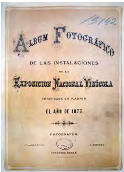
Portada del álbum de la Exposición Vinícola (Bodega Toro Albalá, Aguilar de la Frontera, Córdoba).

La primera cuestión importante que se nos plantea es sobre la verdadera responsabilidad del álbum. ¿Se trata de un trabajo de encargo por parte de los responsables de la exposición, o de una iniciativa de los fotógrafos? Ya hemos visto cómo en el real decreto que ordenaba la celebración de la Exposición se preveía también la publicación de un estudio de la misma y hemos mencionado también la publicación del catálogo. No se dice sin embargo en estos documentos nada acerca de la publicación de un álbum fotográfico, como tampoco hay ningún dato en la portada