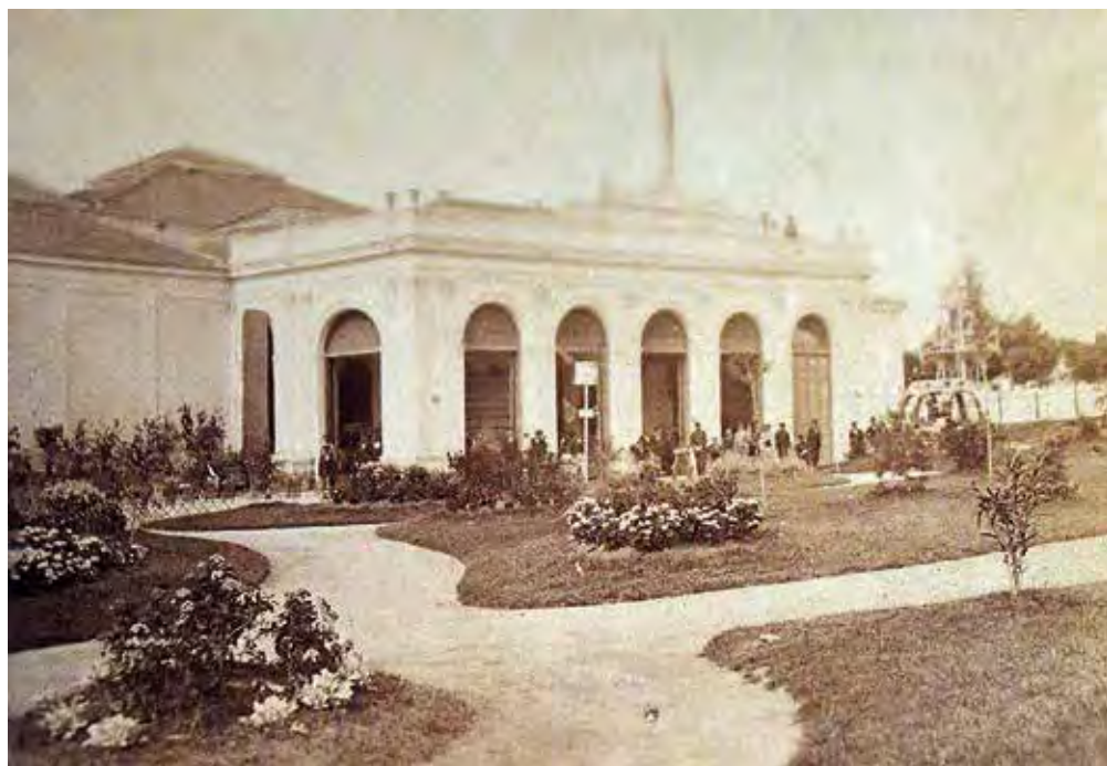
Fachada principal del Palacio de la Exposición (Bodegas Toro Albalá, Aguilar de la Frontera, Córdoba).

De este conjunto de fotografías solo dos de ellas están tomadas de escenas reales de elementos situados en las salas de la exposición. El resto son reproducciones de dibujos o bocetos de los respectivos pabellones. A falta de otra información documental solo podemos hacer suposiciones y conjeturas a partir de las propias fotografías contenidas en el álbum acerca del modo y las circunstancias en que éstas fueron realizadas. Como ya hemos mencionado el número de expositores fue de 7231 y la superficie dedicada a la muestra fue de 3738 m 2 , divididos en doce salas, lo que naturalmente obligó a que la mayoría de los pabellones fueran colecti-