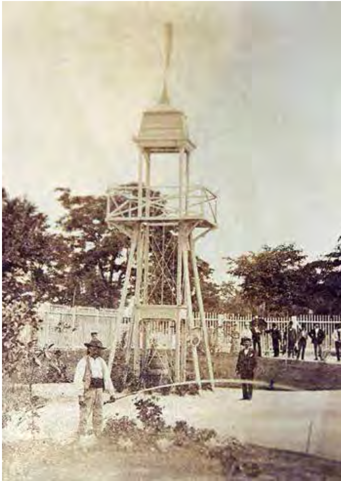
Montacargas del expositor «Merly Sevilla», de Madrid, en el exterior del palacio de exposiciones (Bodegas Toro Albalá, Aguilar de la Frontera, Córdoba).