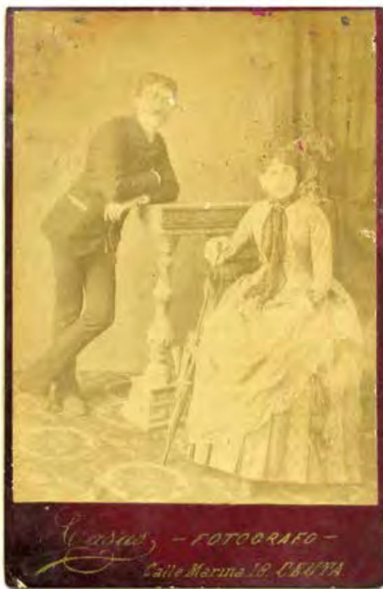
Casas: Cabinet, retrato de pareja, ap. 1880-1885.