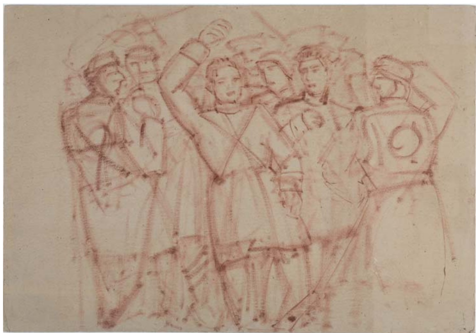
2 y 3. Dibujos preparatorios para el monumento a los Mártires de la Libertad. Museo de Huesca.