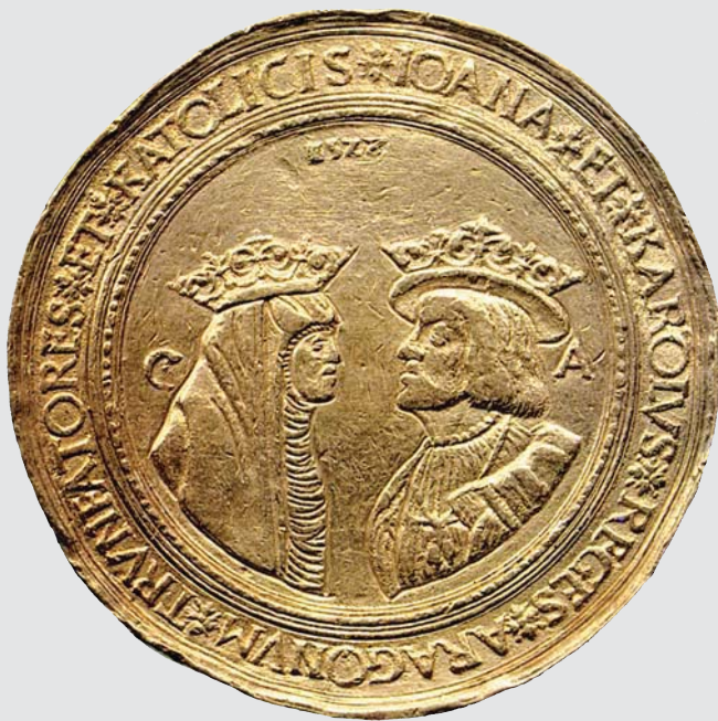
Medalla o moneda de oro, acuñada a nombre de Juana y Carlos, como Reyes de Aragón, equivalente a unos cien ducados. Pieza acuñada en Aragón (Ceca de Zaragoza), con data de 1528. (Biblioteca Nacional de París).