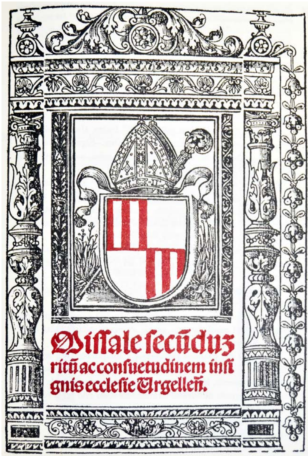
1. Portada orlada del misal de Urgel, impreso por Jorge Coci en 1535.