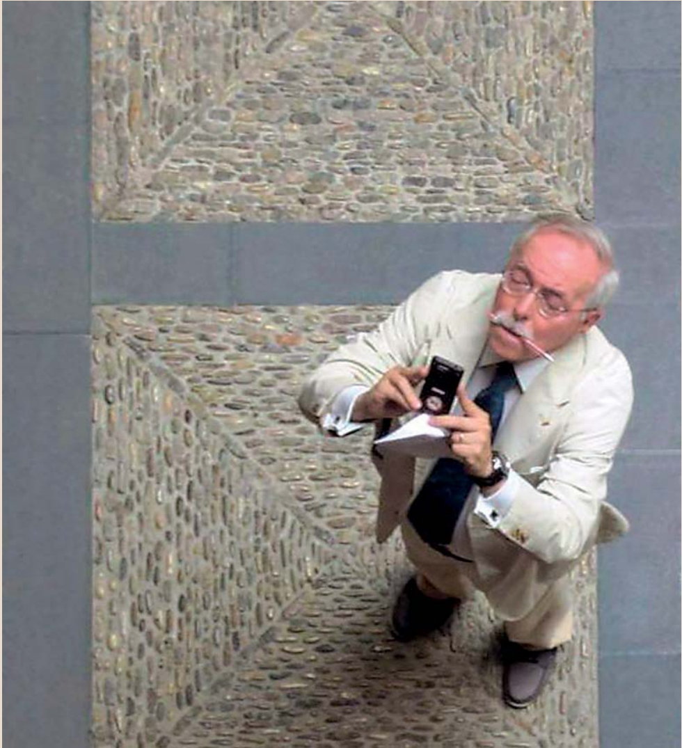
En el patio de la Infanta, 2012.