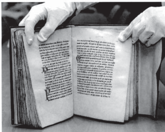
El códice de Miravete de la Sierra se localizó en el archivo municipal de esta localidad.