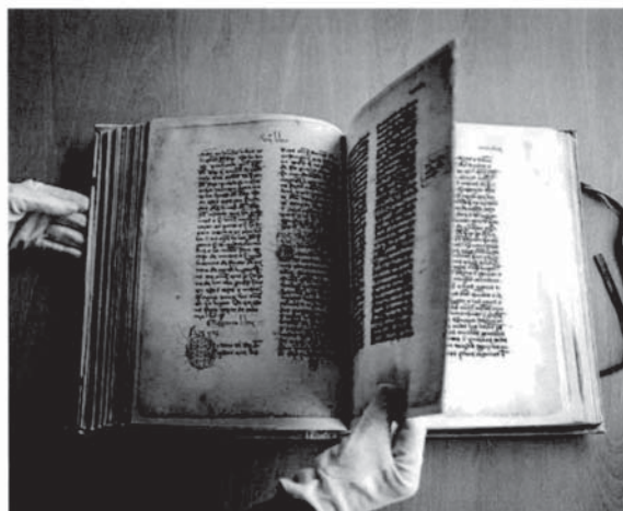
El manuscrito de la Biblioteca Universitaria de Zaragoza fue restaurado en 1981. JOSÉ MIGUEL MARICÓ