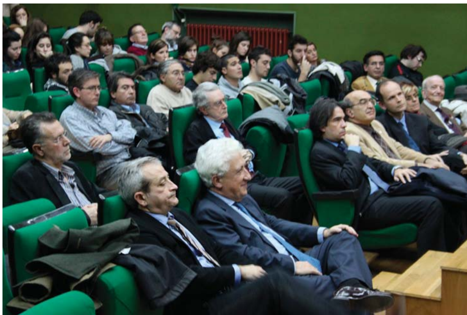
Una gran afluencia de público se congregó a lo largo de las jornadas en el salón de actos del IES Goya.