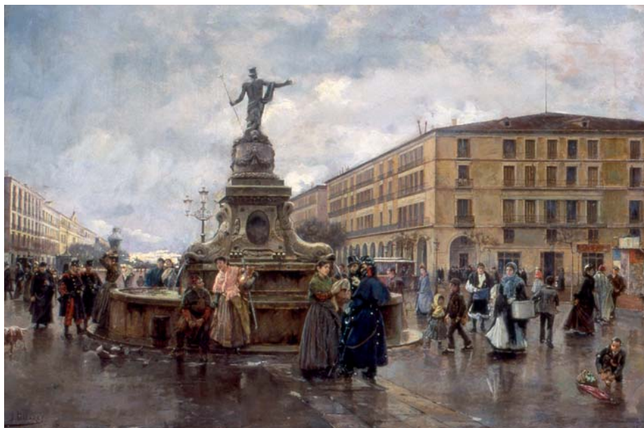
Fig. 12. Joaquín Pallarés: El dios de las aguas en Zaragoza , 1890. MAM, Barcelona.