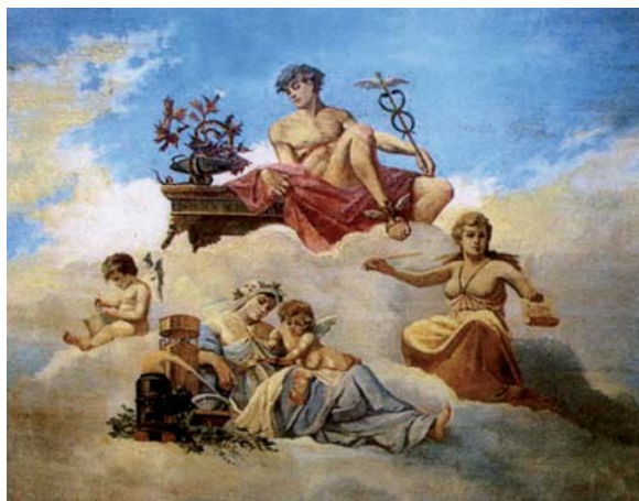
Fig. 16. Evaristo Barrio: Alegoría de Mercurio, la Medicina y la Farmacia . Finales del siglo XIX. Farmacia Ridruejo, Burgos.

Mayor de Burgos, pintada hacia 1890 al óleo sobre lienzo por el ya mencionado Evaristo BARRIO, cuya decoración alegórica ocupa todo el techo cuadrangular del dispensario. Sentó sobre luminosas nubes a Mercurio en la cúspide, escoltado a su izquierda en un escalón más bajo, por la Medicina con una cartela en la que se lee Recipe («toma», el antecedente de las recetas médicas) y al otro lado, en plano inferior, por la Farmacia, como matrona sentada extendida junto a un destilador para la elaboración de preparados y unas plantas medicinales a sus pies.