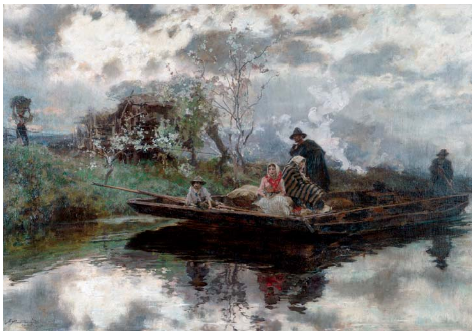
Fig. 21. Francisco Pradilla: Nieblas de primavera , 1907. Col. Ibercaja. Zaragoza.

«de dibujantillo, ahora asombra en París». «Las obras de Pradilla son como él, producto de la meditación y de la corrección académica». 51