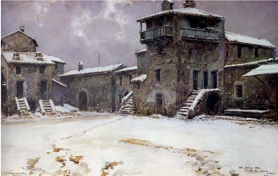
Fig. 24. M. Barbasán: Plaza de Anticoli Corrado bajo la nieve (gouache), 1900. Col. particular. Zaragoza.

Fue su pintura una prolongación virtuosa de la pintura decimonónica de brillante colorido para una clientela internacional que concluirán su ciclo estético con la nueva pintura renovada desde el postimpresionismo y después del mazazo final de la Gran Guerra.