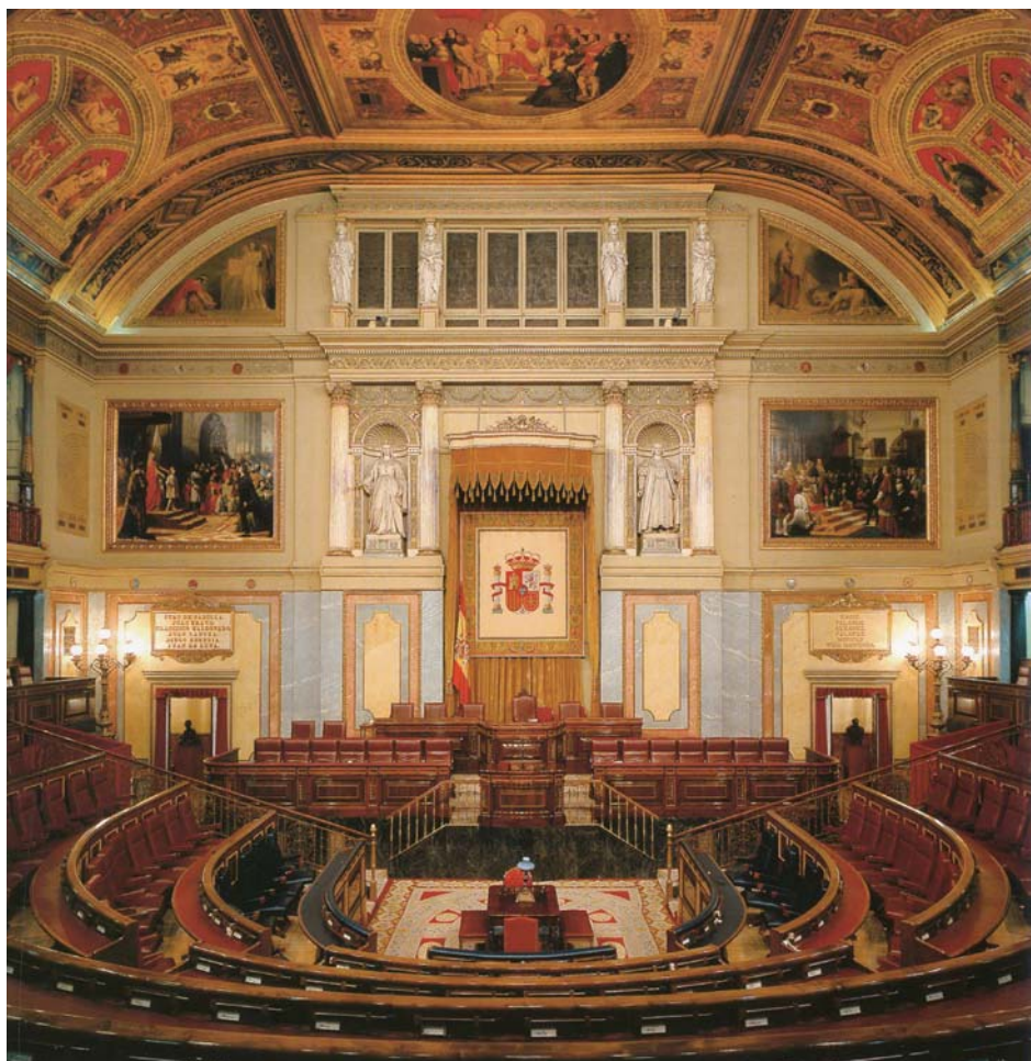
Fig. 14. Salón de Sesiones del Congreso de los Diputados. Decoración de varios escultores y pintores, 1835-1836.