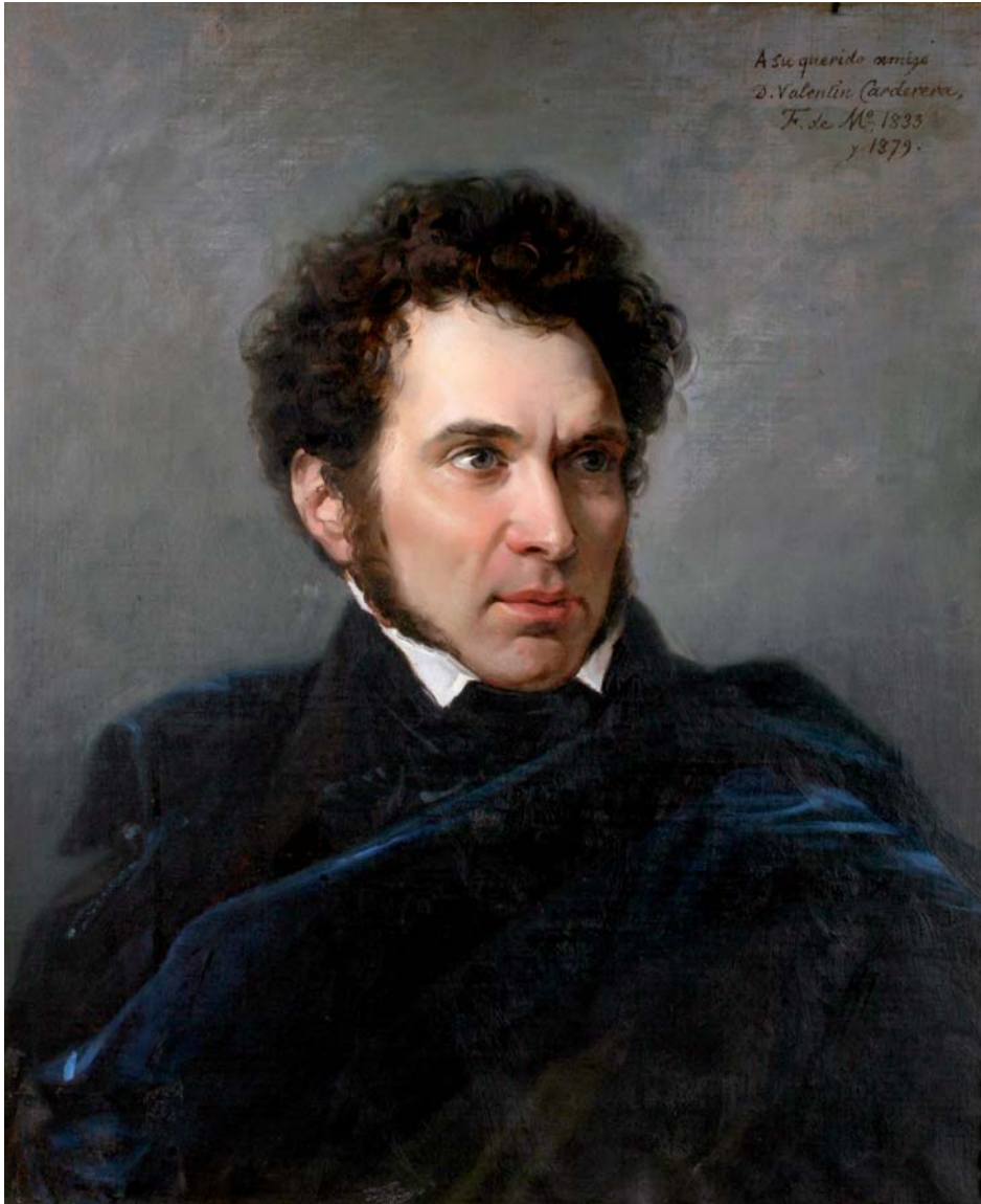
Fig. 2. F. de Madrazo: Retrato de Carderera . 1833 y 1879. Museo de Huesca.