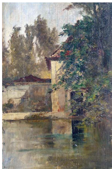
Fig. 10. Enrique Casanova: Torre de las flores . Arrabal de Zaragoza, h. 1880. Col. particular Estepona.