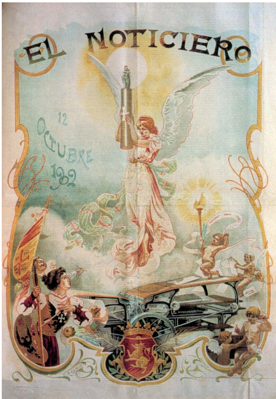
Fig. 1. Ramiro Ros Ráfales: Alegoría de las Artes Gráficas . Cromolitografía de Portabella, 1902.