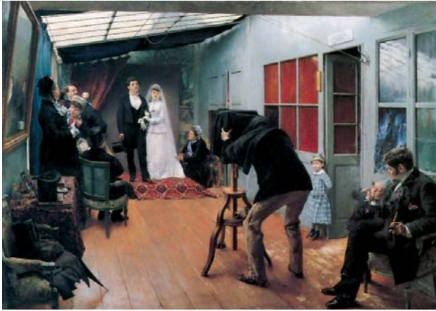
Fig. 3. P. Dagnan-Bouveret: Pareja de novios en el fotógrafo , 1879. Museo de B.A., Lyon.

cuatro estaciones del Vía Crucis (óleo sobre lienzo, 1893) para la ermita del Calvario en Borja.