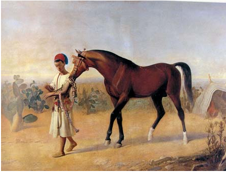
Fig. 19. M. Unceta: Joven marroquí con un caballo y lagarto , 1864. Museo del Prado.

un siglo que fue pródigo en ellas, como Constantin Guys, que lo había sido en la de Crimea. En la mayoría de estos cuadros, los protagonistas fueron los caballos, de variadas capas (como el alazán tostado árabe calzado, guiado por un muchacho marroquí), montados al trote por militares con pintureros uniformes, lo mismo en un desfile que en una carga de la caballería, de picadores dirigiéndose a la plaza, o reyes derrotados camino del exilio, como Boabdil, o al galope desenfrenado Don Rodrigo. Fue indiscutiblemente un destacado pintor animalista, género que trataron con parecido estilo verista otros muchos artistas, nacionales y extranjeros como Palizzi en Italia o Cusachs y el seguidor de Unceta, Segura y Monforte, en España.