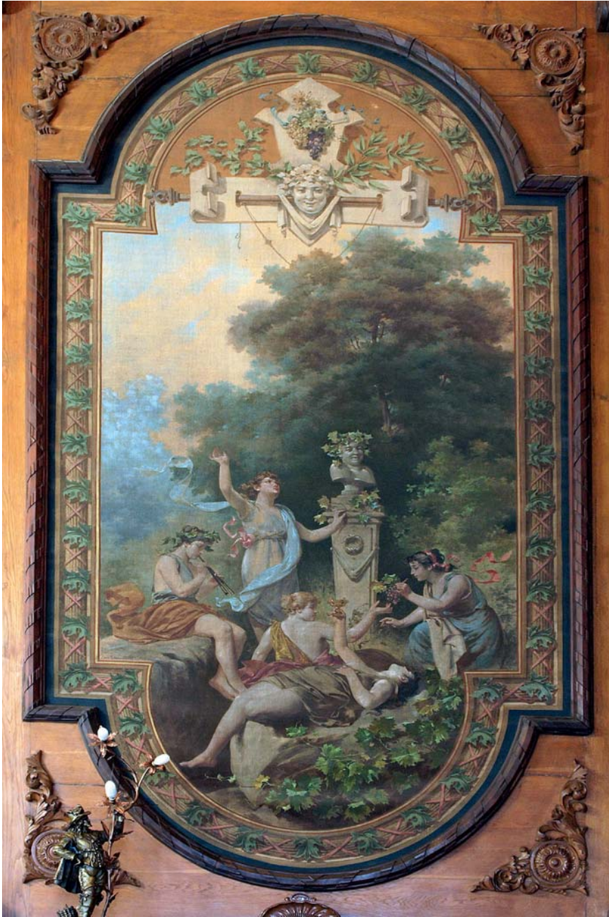
Fig. 18. Luis Taberner: Escena con bacantes . Decoración del comedor de gala de la Capitanía General de Aragón (Tapiz de pincel, 445 x 238 cm) 1893.