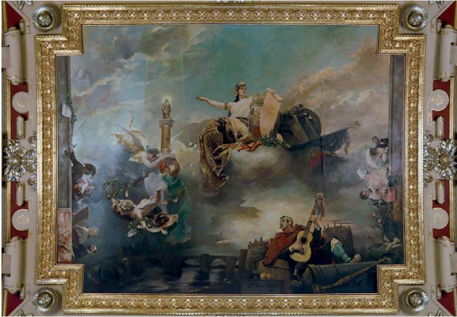
Fig. 15. Alejandro Ferrant: Alegoría de Zaragoza en el techo del salón principal del Casino de Zaragoza (óleo/lienzo, 385 x 493 cm), 1889.

de Santa María, se hicieron pinturas para las llamadas Sala de Reuniones en 1861 y luego para el Salón de Quintas en 1890, para el que Evaristo BARRIO, un zaragozano afincado en Burgos desde 1875, representó un asunto épico apócrifo, La primera hazaña del Cid , deudor, de los efectismos de algunas otras pinturas de hazañas cidianas (la del valenciano Bernardo Ferrándiz, 1869) y hasta de una puesta en escena teatral como en el gran cuadro de Casado del Alisal La Campana de Huesca (1865), adquirido por el Estado. 41