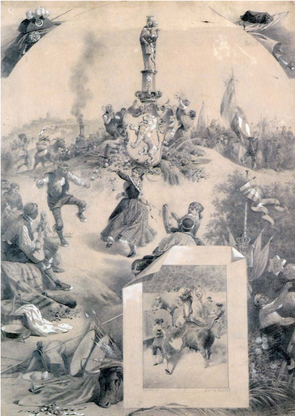
Fig. 8. Daniel Perea: Feria de Zaragoza , 1891 (lápiz y gouache, 70 x 49 cm). Col. particular.