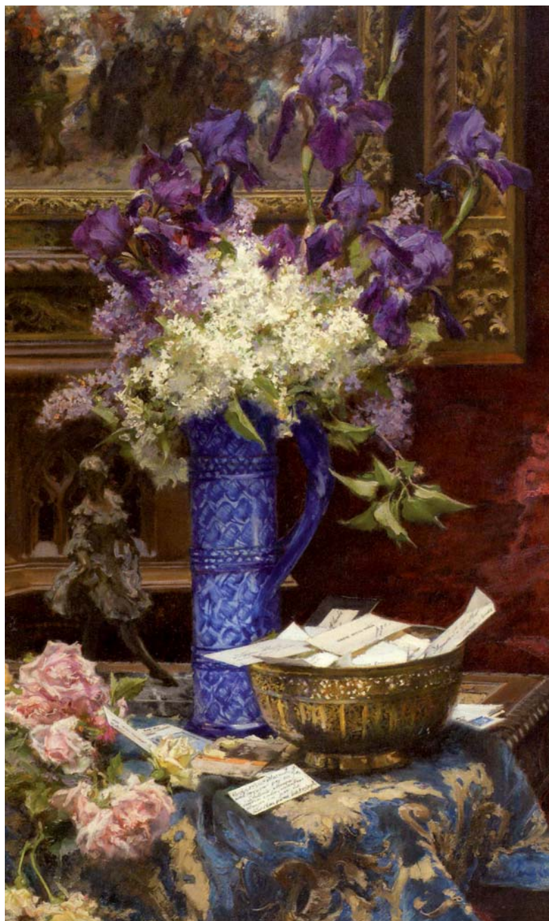
Fig. 22. F. Pradilla: Tarjetero de mi estudio (Oleo/lienzo, 103 x 61 cm), 1916. Col. Rudolf Gerstenmaier. Madrid.