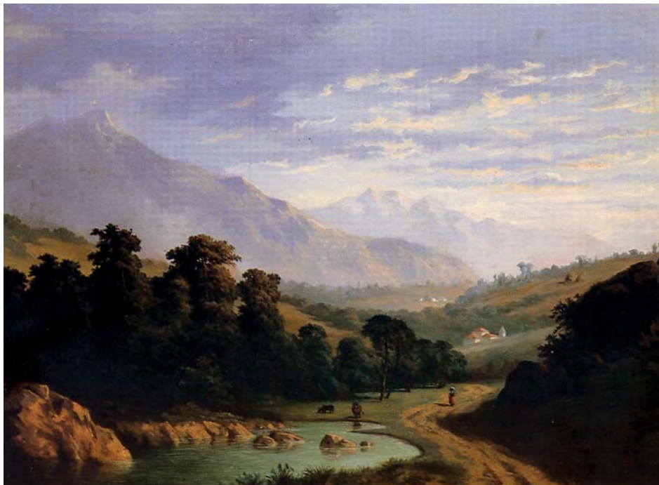
Fig. 9. Ramón Romea: Paisaje asturiano , óleo, 1872. Museo B.A. de Asturias.