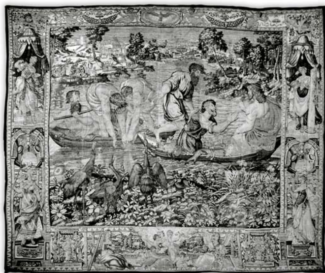
fig. 1. La pesca milagrosa , Bruselas, manufactura de Cornelius Mattens (CM), a partir del diseño de Rafael (lana, seda y oro, 5 x 4,30 m). Procedente de la iglesia parroquial de San Pablo de Zaragoza. Museo Diocesano, Zaragoza.

Finalmente, hace también legados al Colegio de San Pío V de Valencia, a los ejecutores de su testamento (la arquilla con joyas depositada en el mismo archivo de la Santa Iglesia Metropolitana de Zaragoza) y al sucesor del Condado de Santa María de Formiguera, en el reino de Mallorca, las colgaduras de damasco y de brocatel, el dosel de brocado, además de alhajas. 11