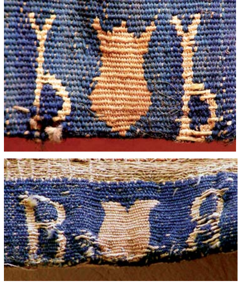
fig. 4. Marcas de la ciudad de Bruselas, en el orillo inferior del tapiz San Pablo y San Bernabé en Listra (arriba) y del tapiz Primado de Pedro (abajo).

Si por las fuentes escritas no hemos podido determinar con seguridad la procedencia de los ocho tapices de la iglesia de San Pablo de Zaragoza, tenemos por suerte esta tapicería que merece un estudio monográfico, si bien en este artículo únicamente podemos hacer algunas consideraciones. Se narran historias del Nuevo Testamento: 1 –La pesca milagrosa (Juan, 21, 1-8); 2 –Primado de Pedro y Pasce oves meas (Mateo, 16, 18-19; Juan, 21, 15-17); 3 – San Pedro y San Juan curando a un paralítico ( Hechos de los Apóstoles , 3, 1-10); 19 4 –Lapidación de San Esteban ( Hechos de los Apóstoles , 7, 55-59); 5 –Conversión de San Pablo ( Hechos de los Apóstoles , 9, 3-7); 6 –La Ceguera de Elimas o Conversión del procónsul Sergio Paulus ( Hechos de los Apóstoles , 13, 6-12); 7 – San Pablo y San Bernabé en Listra ( Hechos de los Apóstoles , 14-8-18) [fig. 3]; 8 –San Pablo predica en el Areópago de Atenas ( Hechos de los Apóstoles , 17, 16-32). Esta serie se ha fechado hacia 1625 (pero nos parece anterior), fue tejida en la manufactura de Bruselas (BB), cuya marca aparece en el