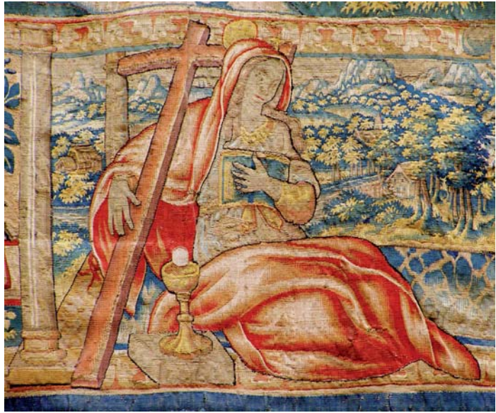
fig. 6. Virtud de la Fe , detalle de la cenefa inferior corrida del tapiz Primado de Pedro , manufactura de Hans Mattens.

días; una escribanía de camino; otra mesa de nogal con cajones que se ha de poner en la pieza antecedente a la grande y a los lados dos taburetes de Inglaterra mencionados y los otros dos con las catorce sillas de terciopelo . 32