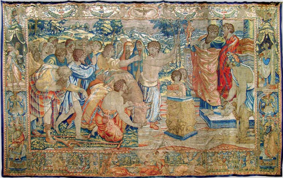
fig. 3. San Pablo y San Bernabé en Listra , Bruselas, manufactura de Cornelius Mattens (CM), a partir del diseño de Rafael (lana, seda y oro, 5,15 x 4,24 m). Procedente de la iglesia parroquial de San Pablo de Zaragoza. Museo Diocesano, Zaragoza.

tados ya el 6 de enero de 1614 cuando el obrero de la iglesia de San Pablo de Zaragoza de ese año, recibe de su antecesor los bienes muebles de dicha iglesia [fig. 2]. 16