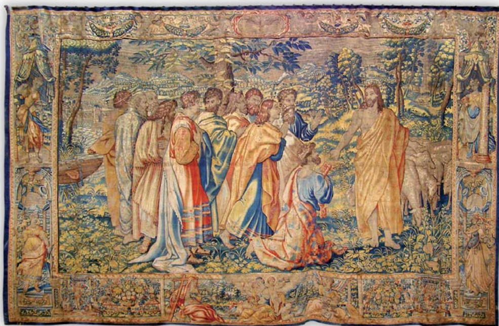
fig. 2. Primado de Pedro (Pasce oves meas) , Bruselas, manufactura de Hans Mattens (HM), a partir del diseño de Rafael (lana, seda y oro, 6,57 x 4,22 m). Procedente de la iglesia parroquial de San Pablo de Zaragoza. Museo Diocesano, Zaragoza.

quitarlos de la nave mayor; y que en los tiempos en que no se usan, se guarden arrollados en sus palos con la mayor curiosidad, sin que puedan extraerse de la iglesia, pena de excomuni3n que tiene la parroquia. 15 El texto es muy ilustrativo del valor que en el siglo XVIII daban a este patrimonio y el inter3s por su conservaci3n, adem3s ya deb3an apreciar el da3o que causa a los tapices la luz natural directa, una cuesti3n primordial en la actualidad para no perder este legado textil.