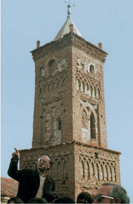
Clase práctica ante la torre múdejar de Belmonte de Calatayud, Zaragoza, 1979.