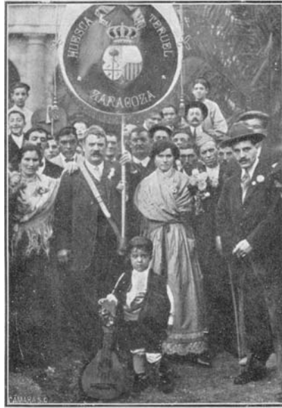
Bilbao.—Parejas aragonesas de canto y baile, que trabajaron en la Fiesta de la Jota organizada en el Teatro de los Campos Eliseos por la colonia aragonesa.