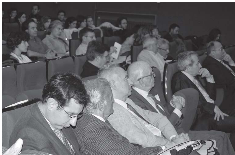
El salón de actos del IES «Goya» contó con una gran afluencia de público durante las jornadas.