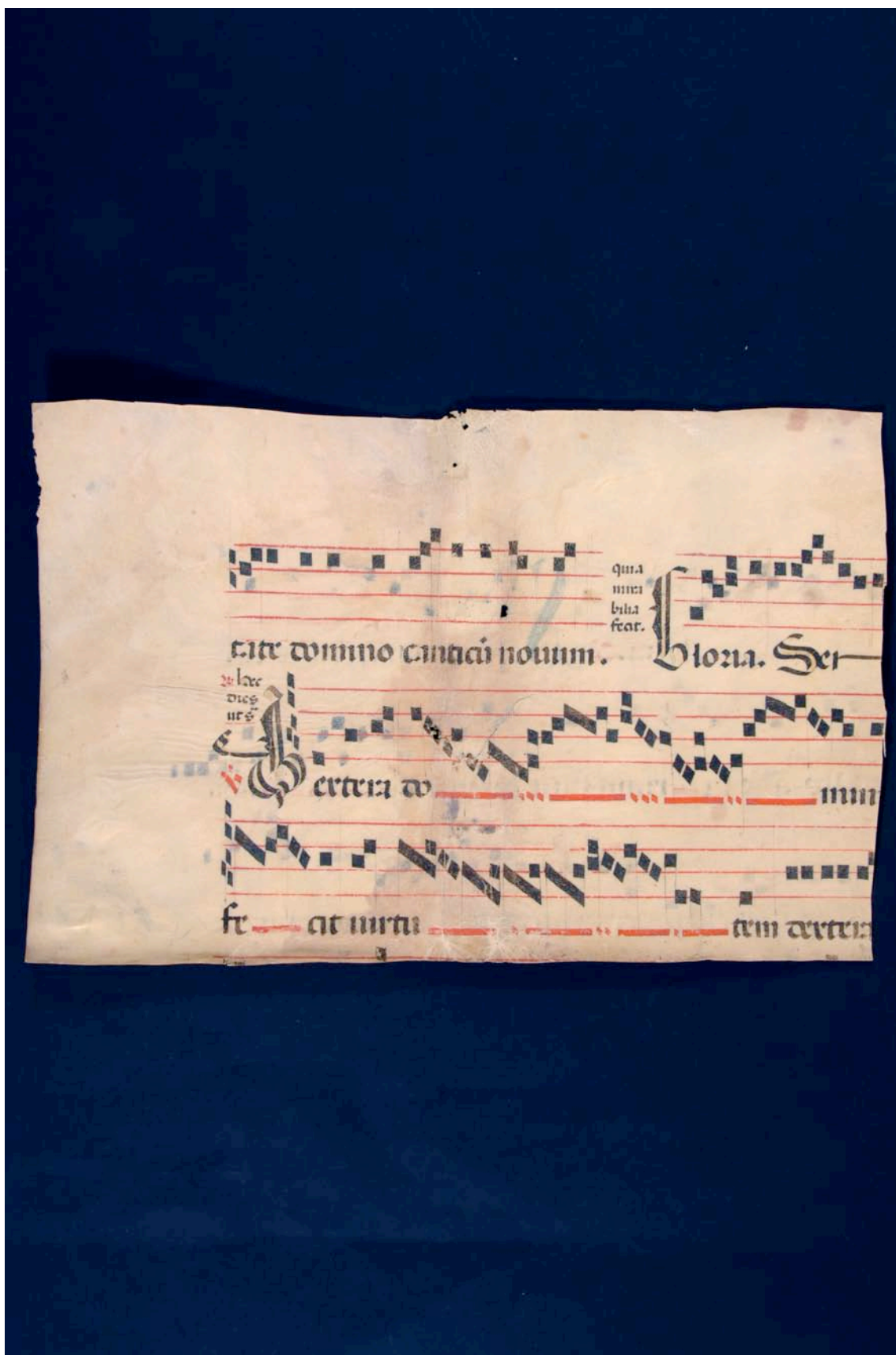
Fragmento 183 v.