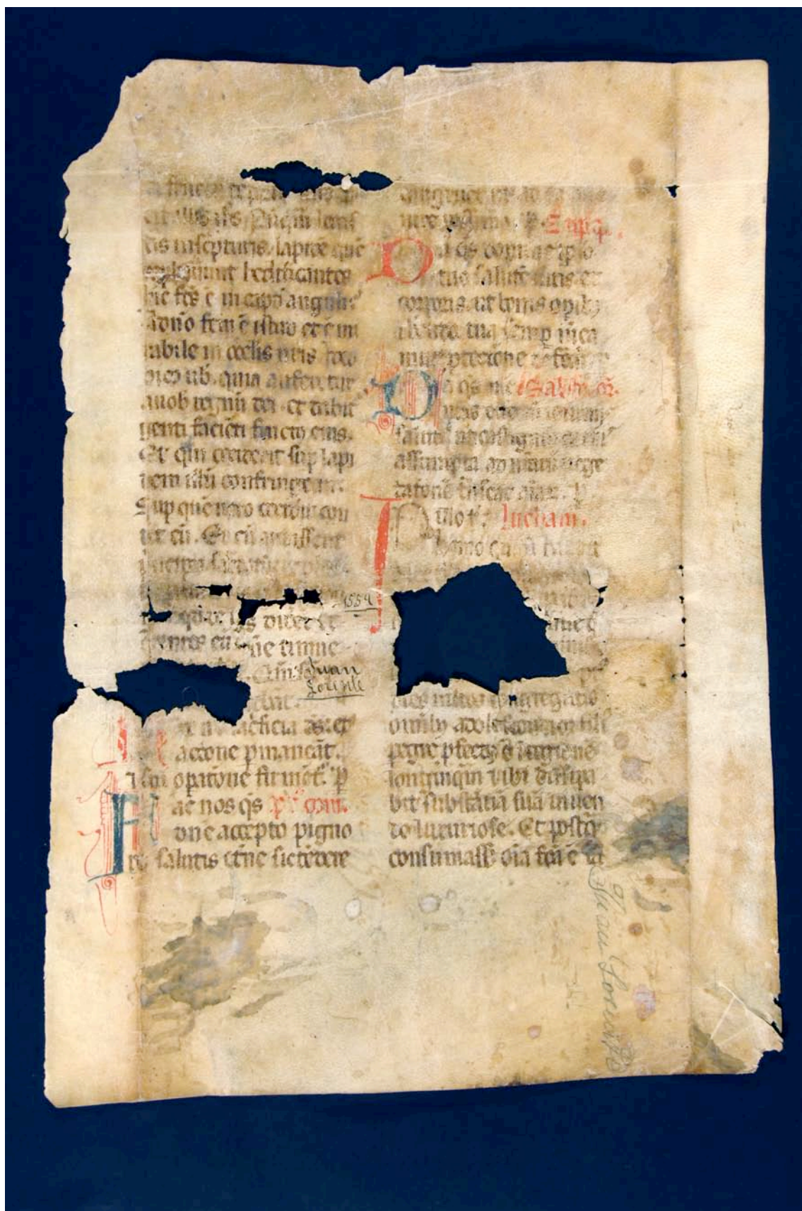
Fragmento 169 r.