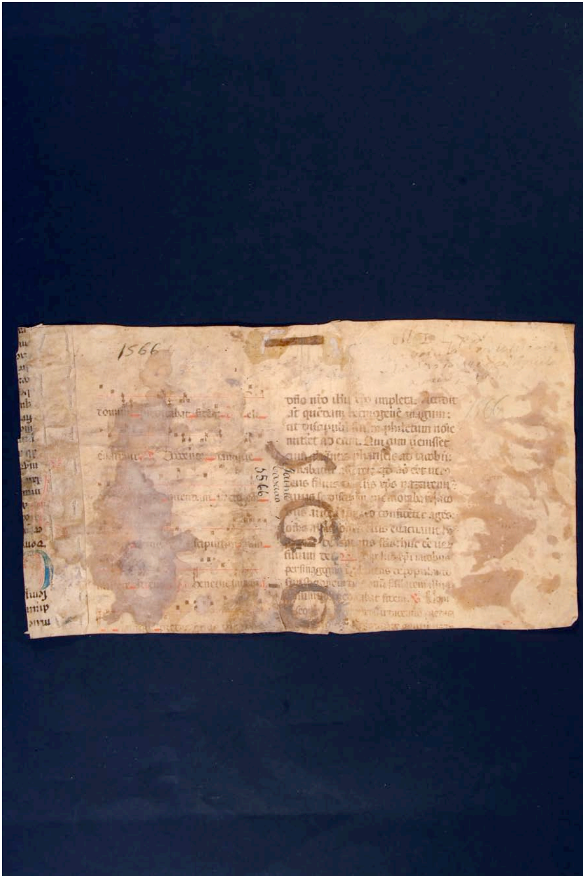
Fragmento 163 r.