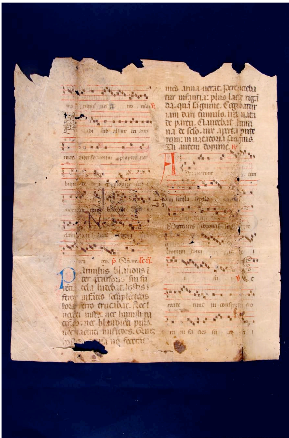
Fragmento 156 v.