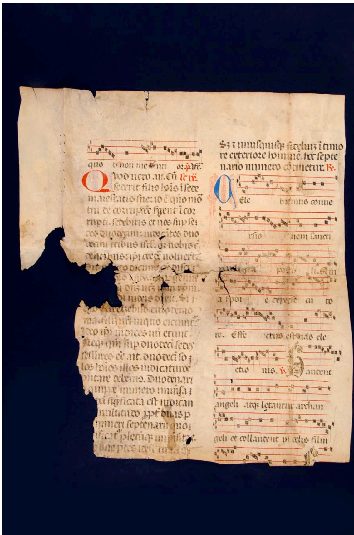
Fragmento 120 v.