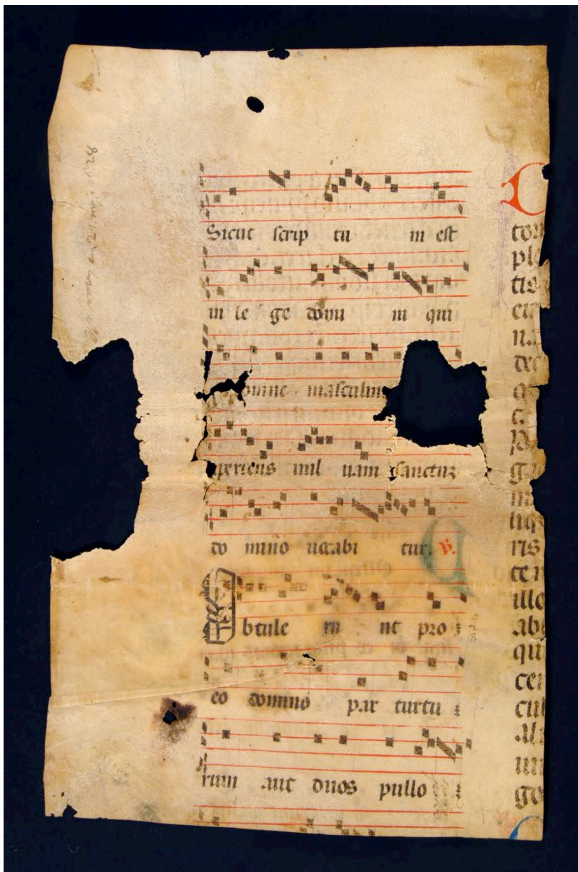
Fragmento 107 v.