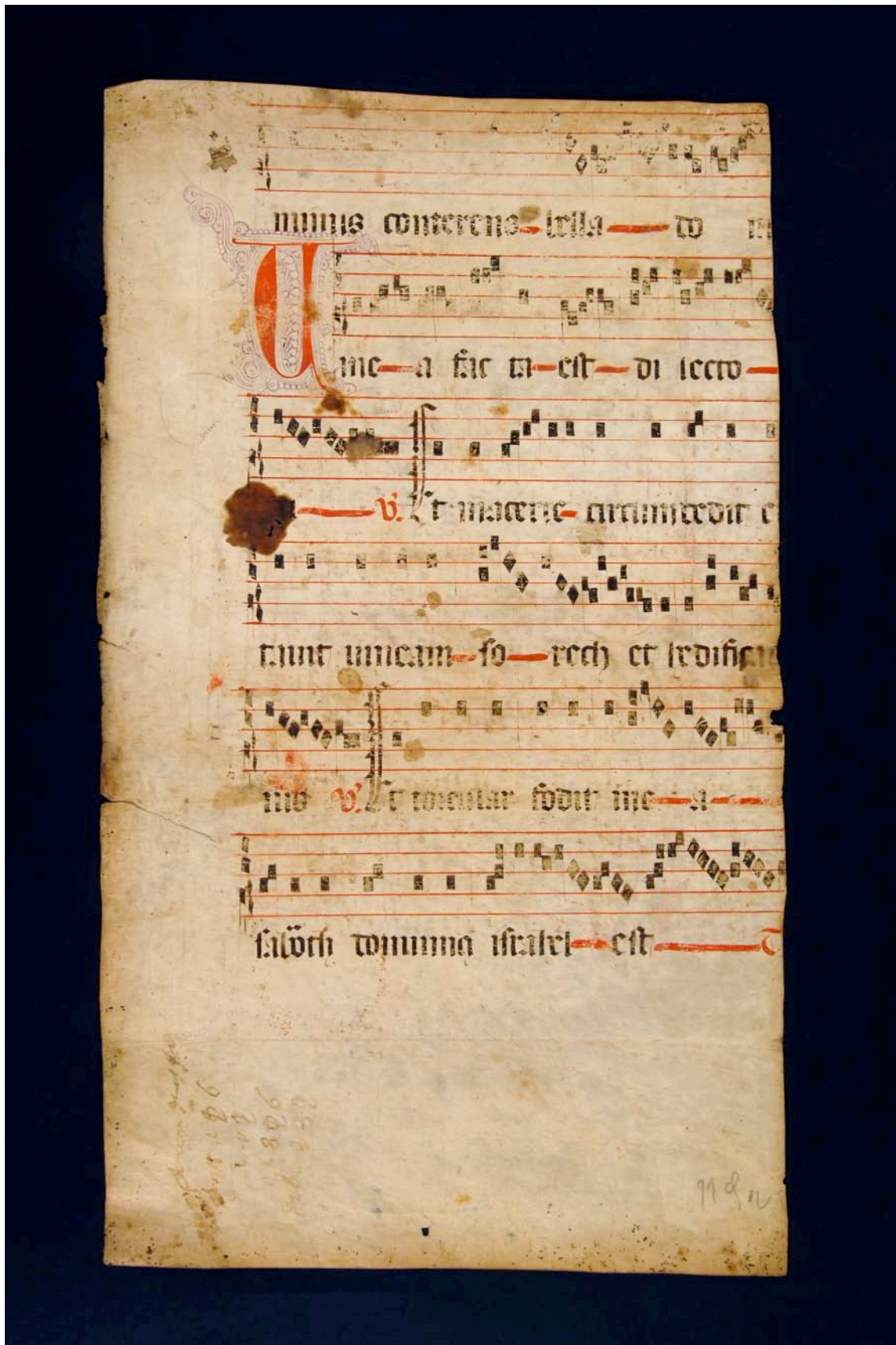
Fragmento 94 r.