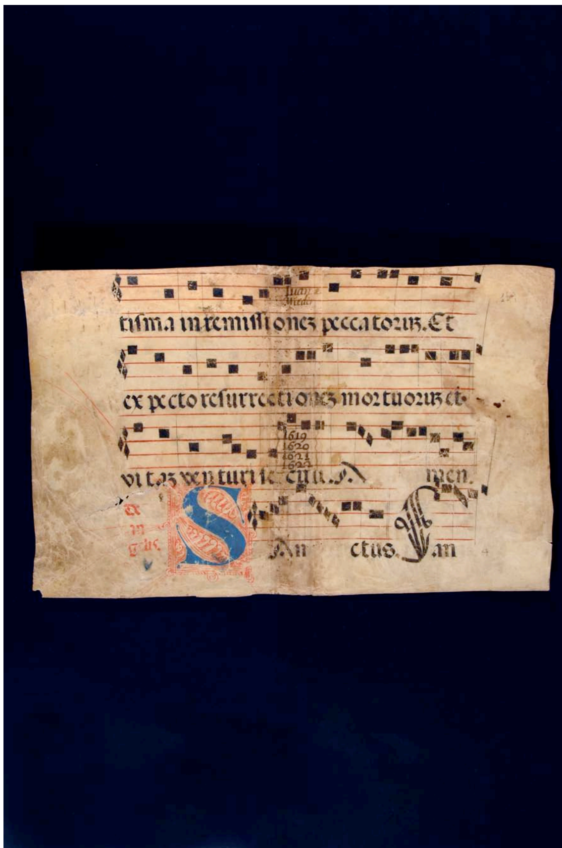
Fragmento 91 v.