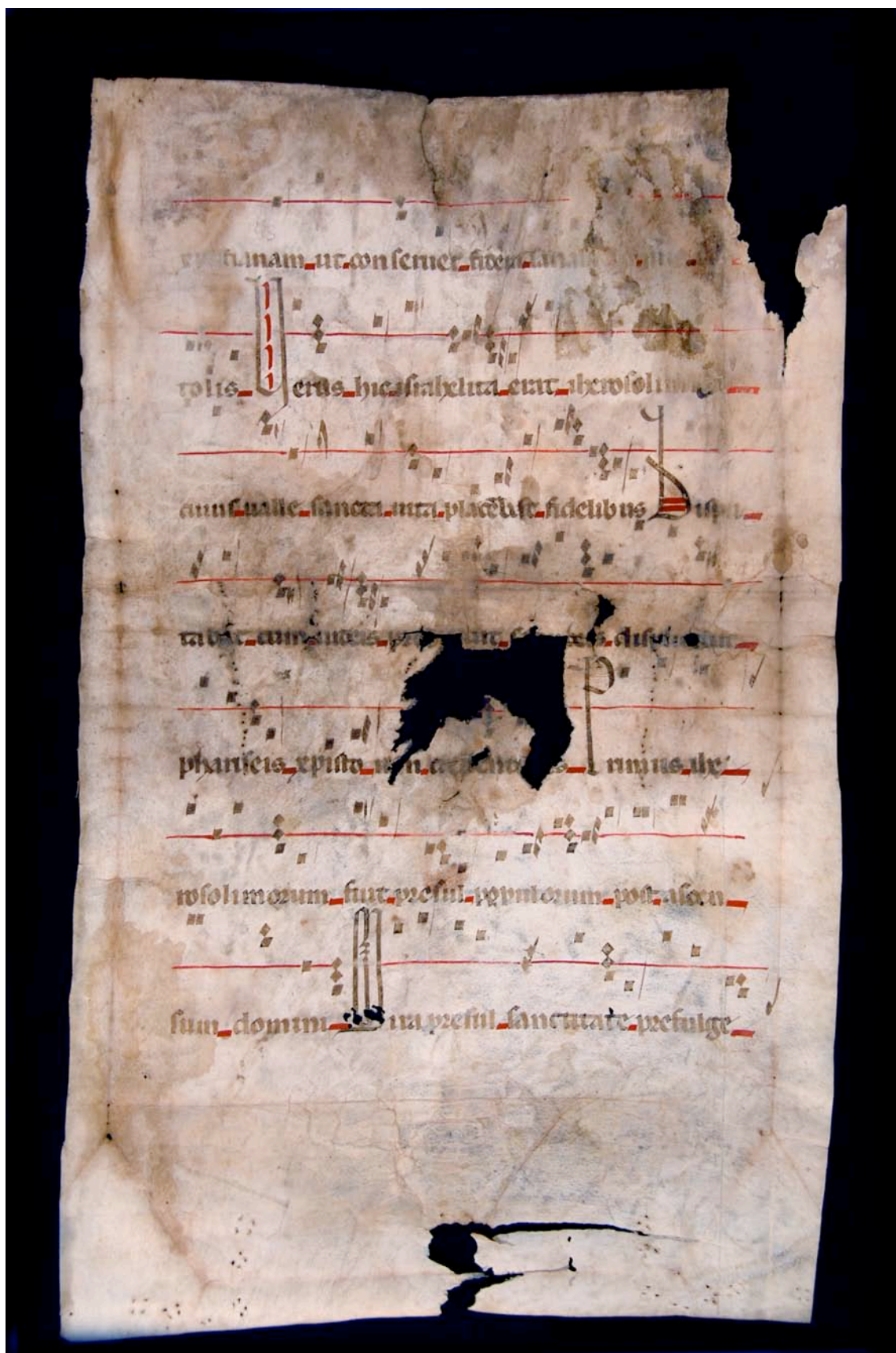
Fragmento 73 v.