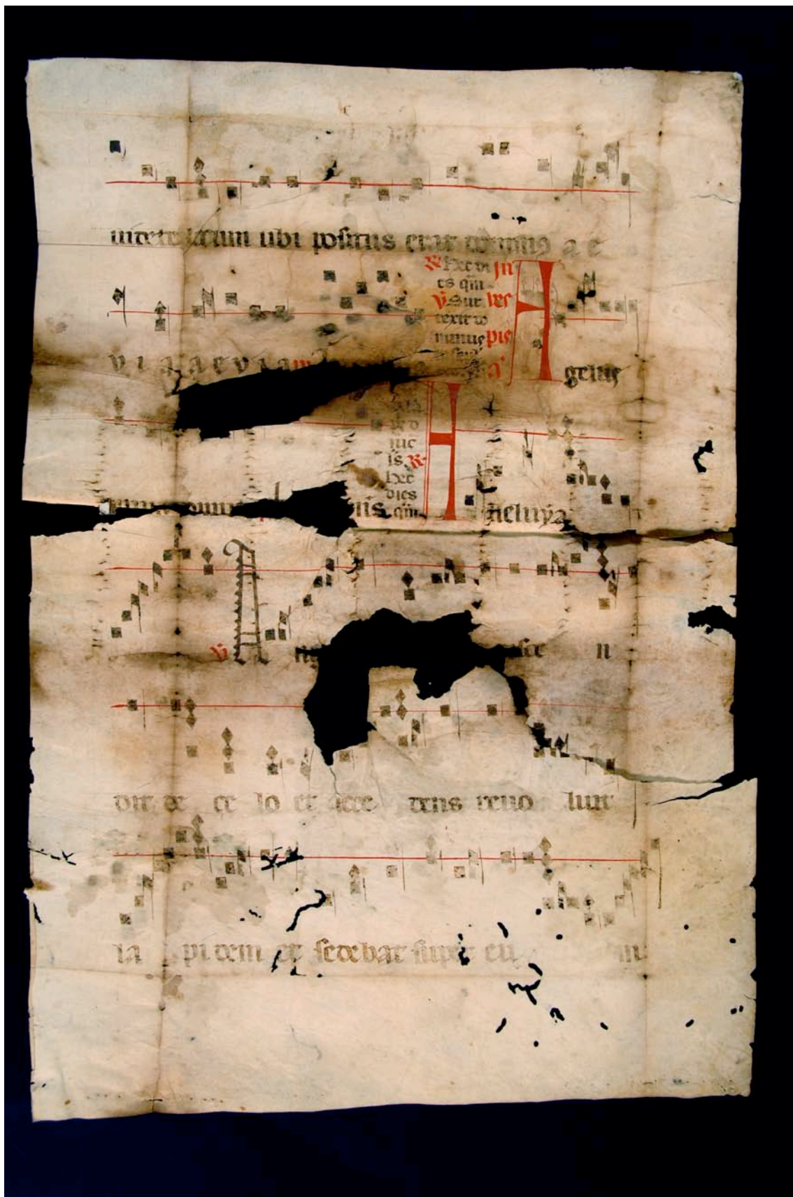
Fragmento 70 r.