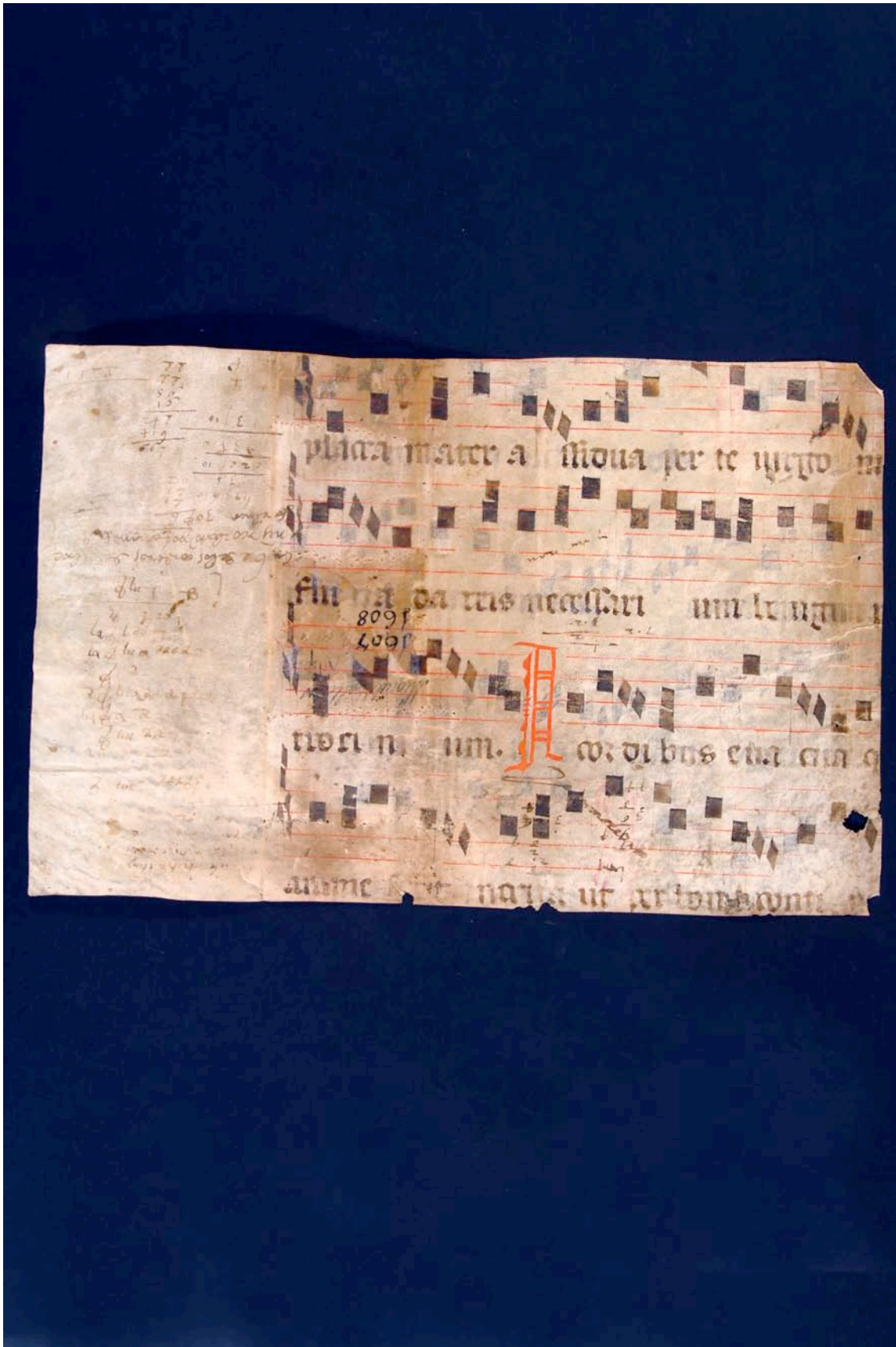
Fragmento 60 r.