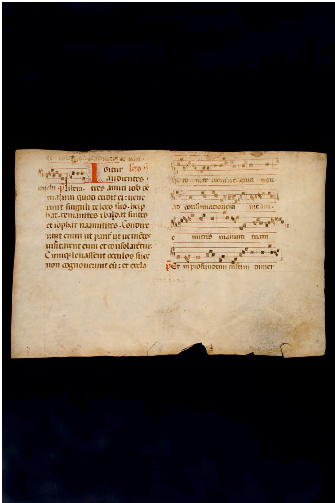
Fragmento 37 r.