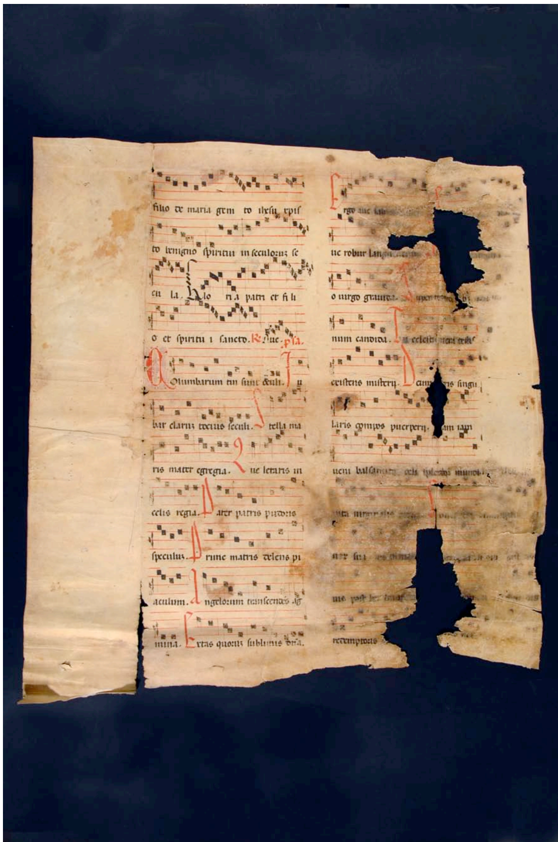
Fragmento 34 v.