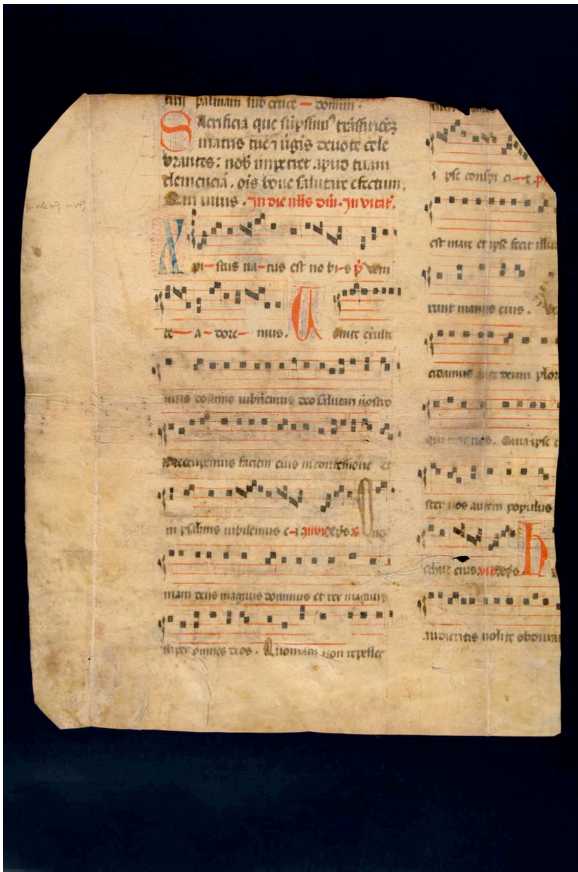
Fragmento 28 v.