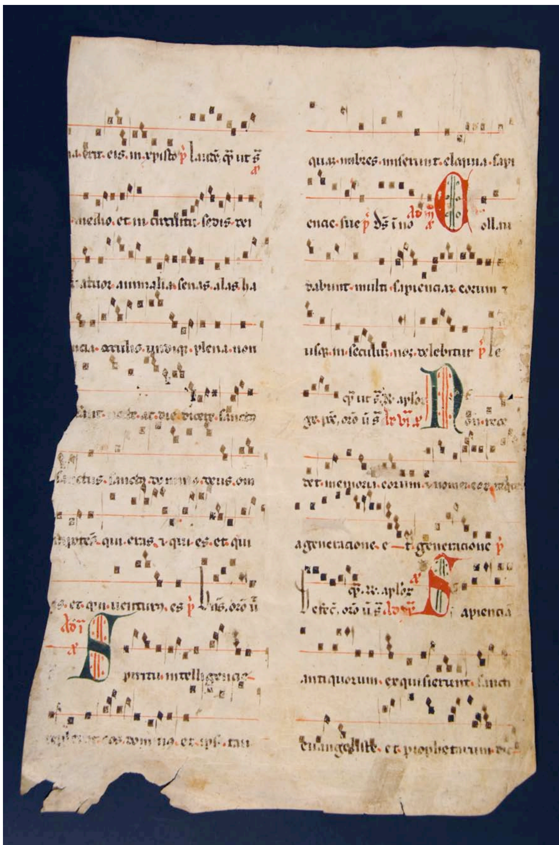
Fragmento 14 v.