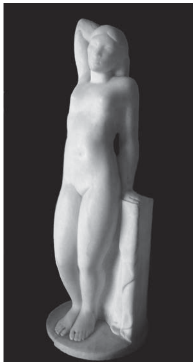
Figura 4. Desnudo femenino .

trabajó bastante en torno a ella. De hecho, realizó la versión pictórica del hipotético retrato, de cuerpo entero y sedente, inserto en un árido paisaje. En la plaza de Miguel Primo de Rivera, se ubicó en recuerdo de Pascual Marquina, el correspondiente busto en piedra. Y en el ámbito de la escultura aplicada a la arquitectura hay que señalar los tres relieves que decoran la fachada del número 122 de la zaragozana calle del Conde de Aranda. Instalados en el edificio construido en 1944 41 , resultan más interesantes, por constituir un trabajo más personal. En ellos se representan tres figuras femeninas de perfil, arrodilladas y semicubiertas con paños.