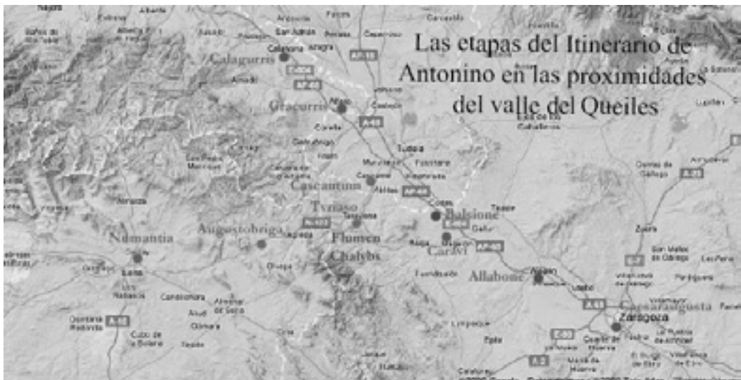
Lámina 2. Ciudades mencionadas en el Itinerario de Antonio en torno al valle del Queiles.