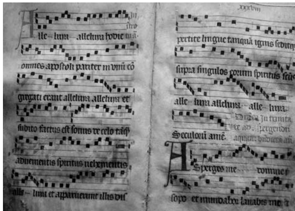
Fig. 1. Disposición con 6 líneas músico-textuales (ff. 37v-38r).