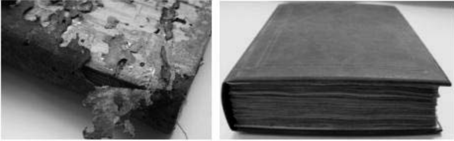
Fig. 6. Comparativa de la vieja y nueva encuadernación.