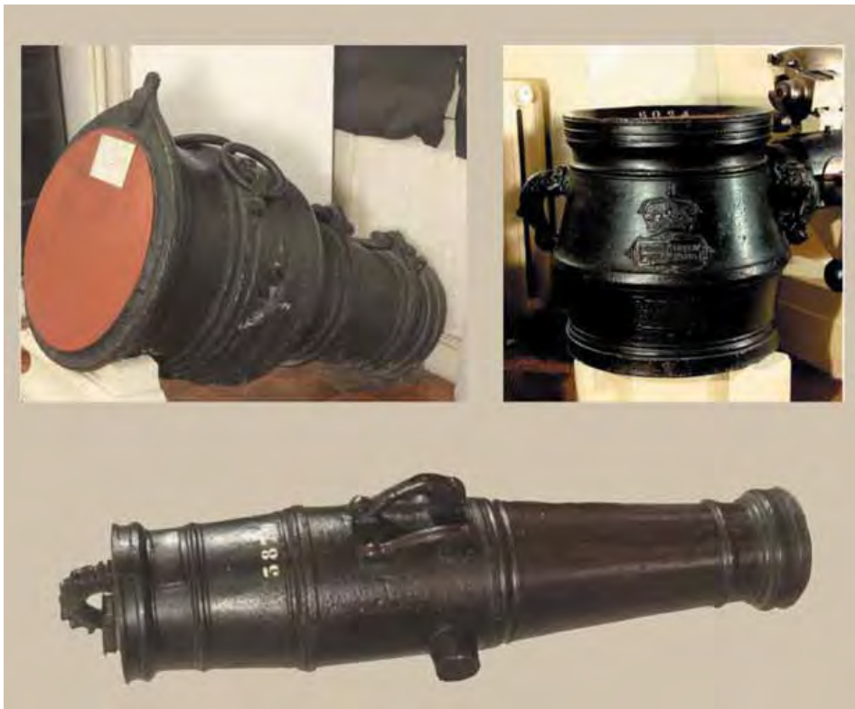
10.3. Pedrero (s. xv), mortero (s. xvi) y berraco (s. xvi). Museo del Ejército, Madrid.

Bombardas o lombardas. Son piezas compuestas de dos partes: una anterior, denominada caña , y otra posterior denominada trompa , recámara , másculo o servidor . Una vez colocada en ella la pólvora, se enchufaba a la primera y al tiempo se sujetaban ambas partes entre sí y al afuste por medio de cuerdas. De diversos calibres, eran unos materiales a veces gigantescos y por tanto muy pesados.