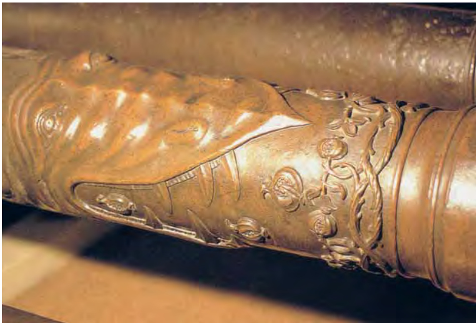
10.7. Culebrina fundida en bronce y decorada (s. XVI). Museo del Ejército, Madrid.

Ufano, Collado y otros tratadistas informan de las operaciones realizadas hasta activar las piezas de artillería. Una vez efectuado un disparo, el artillero se aprestaba a desatascar el fogón , y a continuación a limpiar el interior o ánima del cañón introduciendo un escobillón seco; después tomaba el cargador o cuchara previamente llena de pólvora de un tonel o saco próximo a la pieza, y la introducía con su carga hasta la altura del fogón; después de girar el mango para depositar la pólvora se saca-