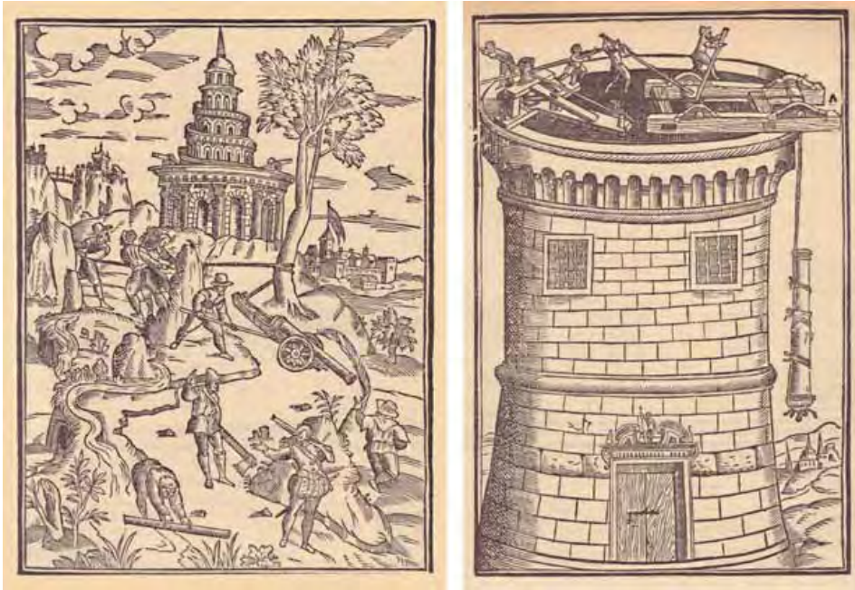
10.1. Traslado y emplazamiento de artillería. L. Collado, Platica manual de artillería (Milán, 1592).

Lo mismo se puede decir del artillado de las plazas, asunto siempre complicado por la escasez de medios, personal y dificultad de comunicaciones, lo que obligaba a enviar artillería de unas guarniciones a otras. La situación debió de mejorar algo a partir de 1550, una vez finalizada la guerra contra los luteranos, lo que permitió al emperador enviar a España 258 piezas del botín de guerra. Solo 106 estaban en condiciones de uso, mientras que las 152 restantes fueron destinadas a su fundición, en muchos casos por la aparición de grietas internas, «escarabajos» 5 .