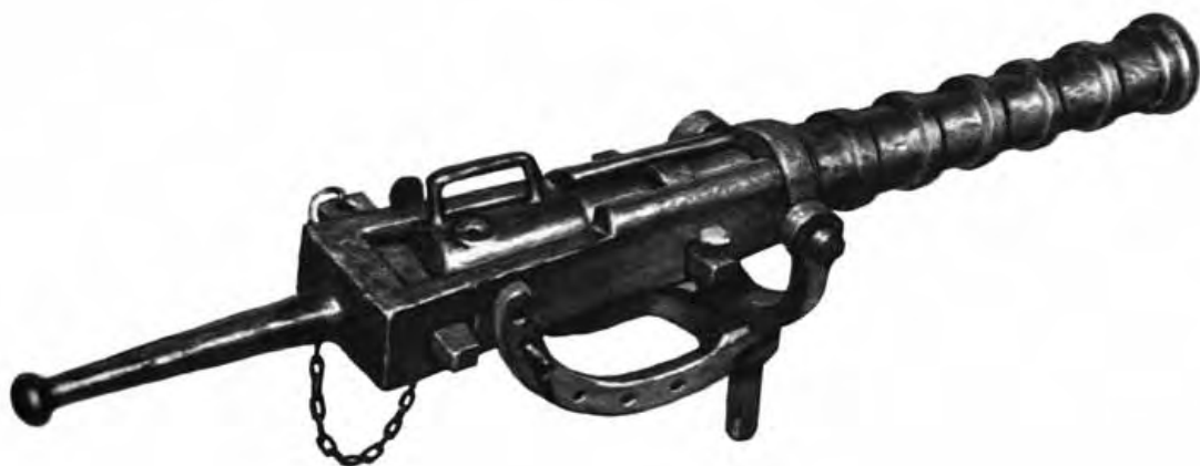
10.2. Culebrina de hierro forjado , de 2,5 pulgadas de calibre y sistema de retrocarga con cubilete y cuña.

son elocuentes sobre la complejidad que suponía organizar y mandar semejante dispositivo bélico 6 .