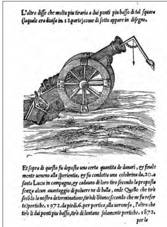
10.6. Cañón montado en su cureña, midiendo la elevación con un cuadrante. Hernán del Castillo , Libro muy curioso y utilísimo de artillería, h. 1560. Biblioteca Nacional, Madrid.

pólvora, la situación del emplazamiento, y naturalmente de la experiencia de los servidores: Se obtuvieron alcances que pueden superar ampliamente los 2.500 metros.