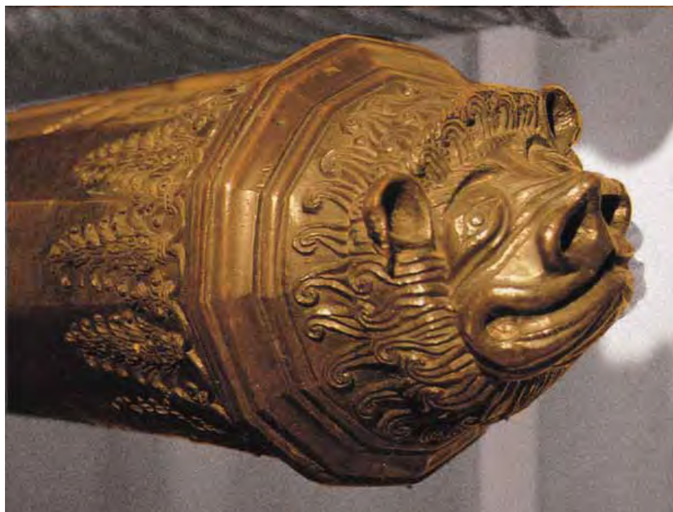
10.5. Culata de media culebrina con cabeza de murciélago (s. XVI). Museo del Ejército, Madrid.

En lo que sí se puede convenir es que se había pasado de las toscas bombardas a unos tipos de cañones de bronceíneas superficies, excelentes soportes para los cinceladores, que tallaron citas, alusiones o símbolos heráldicos, muy en consonancia con el espíritu del Renacimiento al hacer de unas máquinas de guerra acabadas obras artísticas. El primer cuerpo de los cañones suele acoger el escudo y nombre del monarca, mientras en la faja alta de la culata aparecen el nombre del fundidor, la ciudad y la fecha de fundición. En los muñones laterales se graban el peso en quintales y libras y la procedencia del cobre y estaño utilizados. La parte