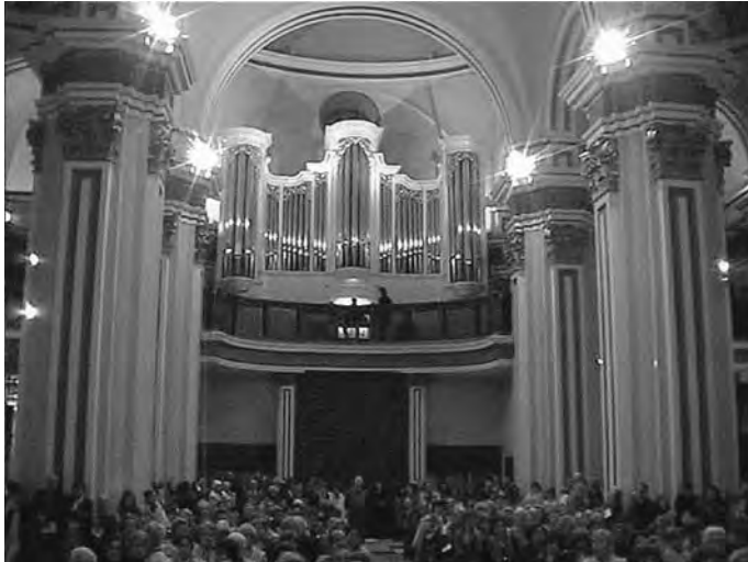
Vista general del concierto.