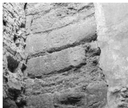
Torre de Ainzón.

De ahí la necesidad de corregir los errores advertidos y ampliar esta relación con los numerosos monumentos que, por el momento, han quedado al margen.