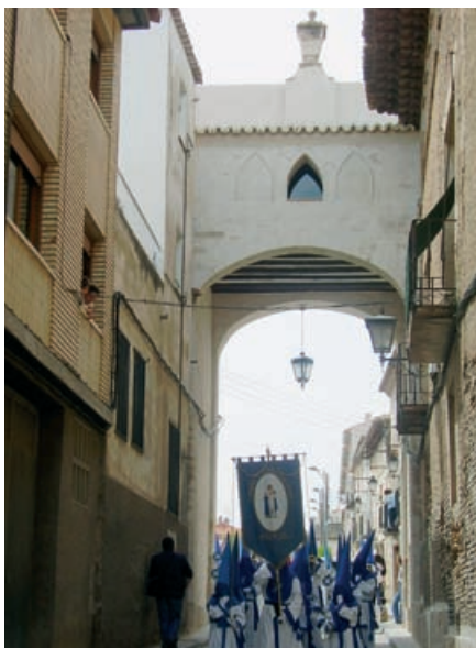
El arco en la actualidad.

Estamos, por lo tanto, ante una obra de gran interés porque ha permitido la recuperación de otro monumento emblemático de nuestra ciudad, haciendo concebir esperanzas de que, muy pronto, se lleve a cabo la recuperación de la otra puerta de la ciudad: el arco de la Carrera o puerta de Zaragoza.