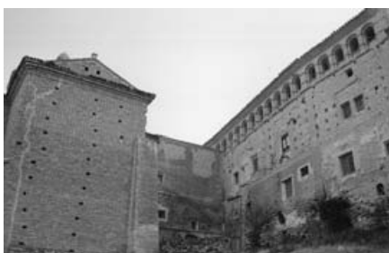
Palacio de los Condes de Bureta.

Pero centrándonos en nuestra comarca, han sido califica-