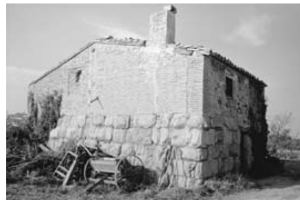
Torreón islámico de Magallón.

El hecho de que entre los mismos se incluyan monumentos ya declarados sin hacer re-