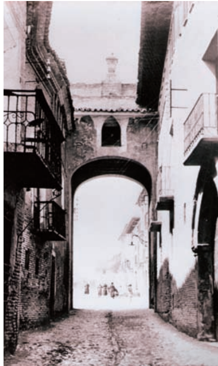
El arco antes de ser derribado.

No disponemos, todavía, de datos que puedan establecer la fecha de su construcción. Sus dos pilastras que sostienen un entablamento sobre el que se asienta el frontón curvo, así como el enlucido, lo enmarcan dentro del gusto neoclásico. Pero es indudable que la obra ha sufrido diversas reformas y el recrecimiento con su remate de piedra parecen posteriores.