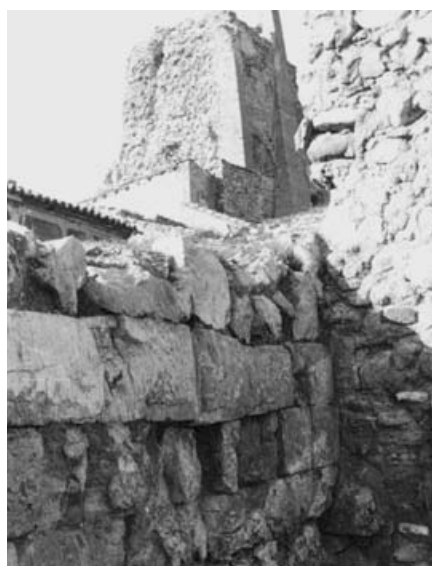
Murallas islámicas de Borja.

— Torreón de los Benamir de Borja . Un hallazgo del que dimos cuenta a través de un artículo publicado en esta revista. Está documentada su construcción y se conserva íntegro.