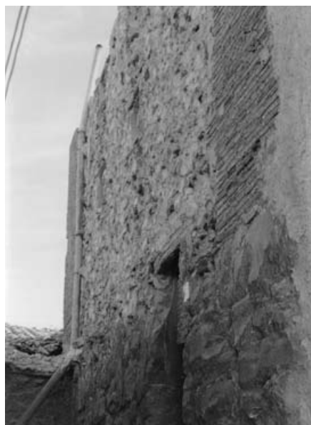
Castillo de Agón.

dos como Bienes de Interés Cultural los siguientes: