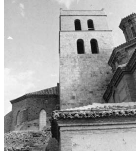
Torre de la iglesia parroquial de Magallón.

Es cierto que en el preámbulo se hace referencia a estos aspectos así como al hecho de que adquieren la condición de "Bienes de Interés Cultural" algunos monumentos que, no hace mucho, fueron declarados "Bienes Catalogados", afirmando tan sólo que "esta misma categoría de Bienes de Interés Cultural tendrán aquellos casti-