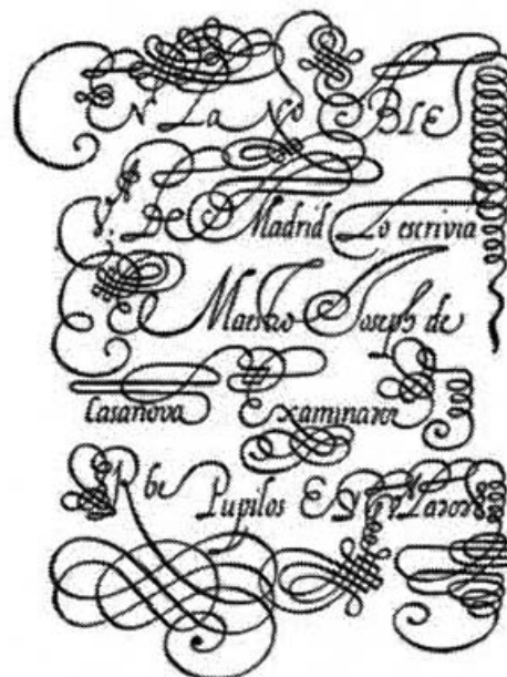
LETRA DE CASANOVA