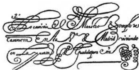
LETRA DE CASANOVA

De la importancia de este magallonero que llegó a ser "Examinador de Maestros de Caligrafía" y de sus relaciones con otros personajes de la Corte, da buena prueba el que, entre los habituales elogios que se incluyeron al co-