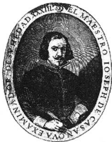
JOSÉ DE CASANOVA

mienzo de la obra, hay un poema de Calderón de la Barca y otro de Moreto.