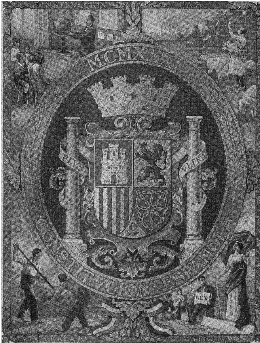
Lámina I. Escudo de la República Española.