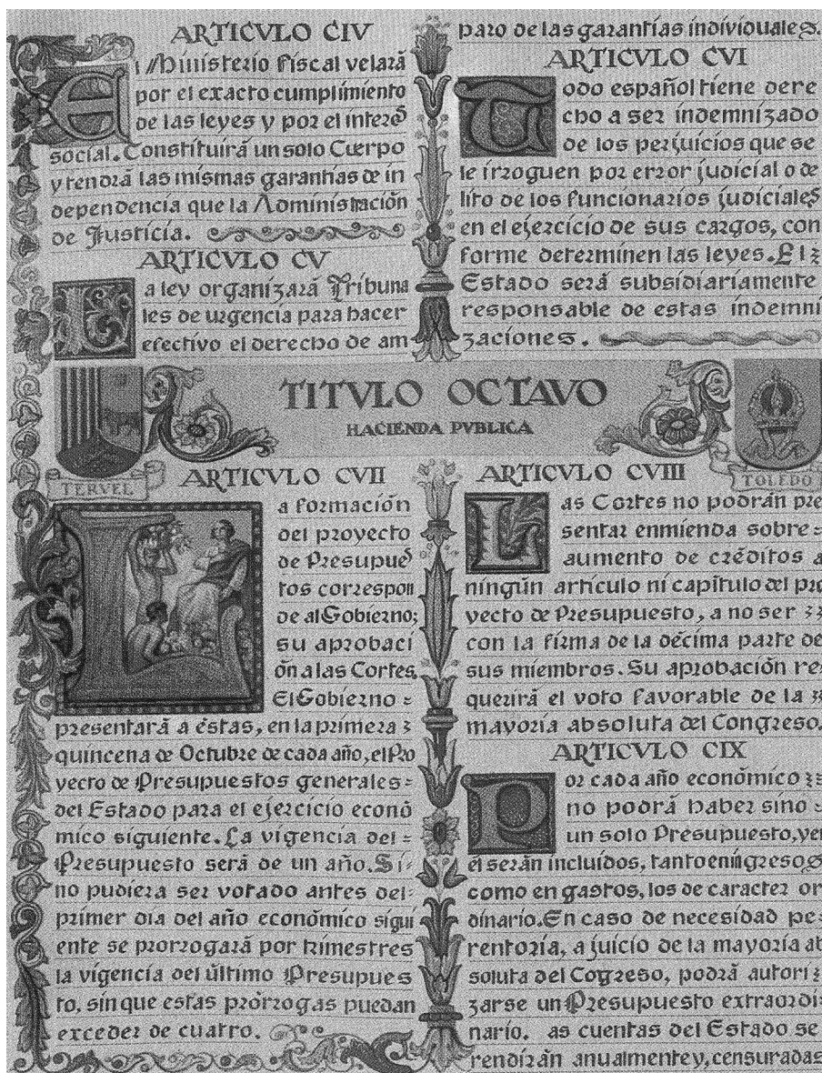
Lámina III. Escudo de Teruel.