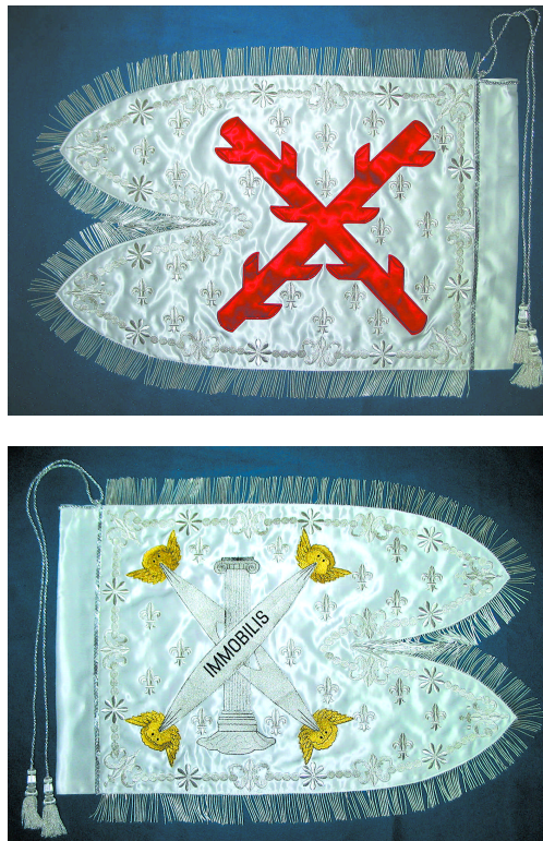
Fig. 5. Anverso y reverso del Guión Farpado.