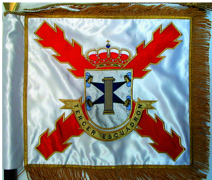
Fig. 2. Banderín de escuadrón.