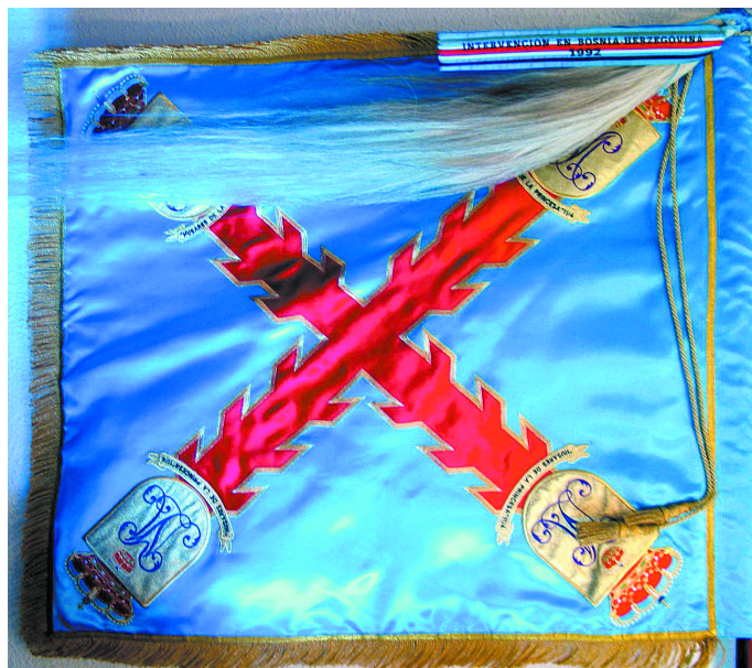
Fig. 1. Guión del Grupo de Caballería Mecanizado «Húsares de la Princesa».