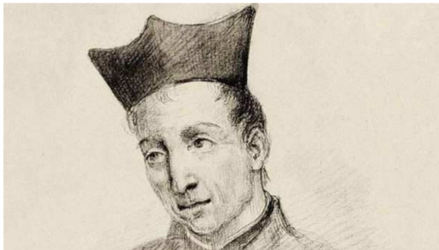
Retrato de Baltasar Gracián por Vicente Cardenera

Sabemos que el día del 78 cumpleaños del Santo Padre fue un día sin actos especiales ni fuera de la normalidad, ya que él mismo quiso pasarlo sin alterar su rutina diaria y, como de costumbre, con todos los trabajadores de Santa Marta.